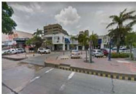
ESTADO ACTUAL DEL ESPACIO PÚBLICO CARRERA 52