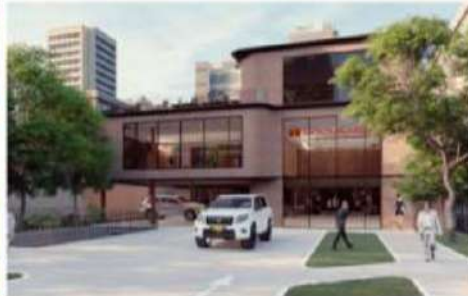
PROPUESTA DE AMPLIACIÓN 2021

JUSTIFICACIÓN: De acuerdo con la clasificación del inmueble y el tipo de obra a realizar, se considera que la nueva propuesta armoniza con el entorno y es de impacto positivo para el sector.