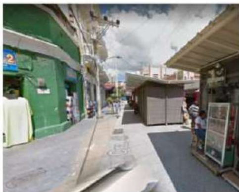
INICIO DE OBRA - K 42 CALLE 31