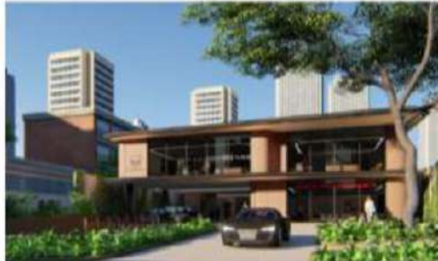
PROYECTO APROBADO 2020