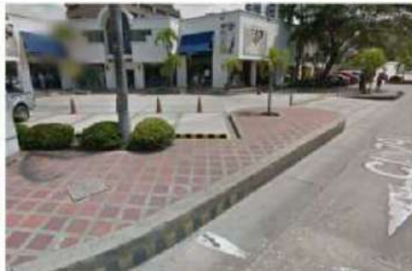
ESTADO ACTUAL DEL ESPACIO PÚBLICO CALLE 79

DESCRIPCIÓN: El proyecto consiste en reconstruir el andén que se encuentra deteriorado compuesto principalmente de concreto agrietado y terreno natural sobre la calle 79 y carrera 52, con el mismo diseño de losetas que el Distrito utilizó sobre los andenes de la canalización de la calle 79 hasta la carrera 52, en un área a intervenir de 432.16 m 2 . De esta manera se busca reconstruir el andén, bordillo y jardineras siguiendo los lineamientos del anexo 4 del POT: manual de espacio público