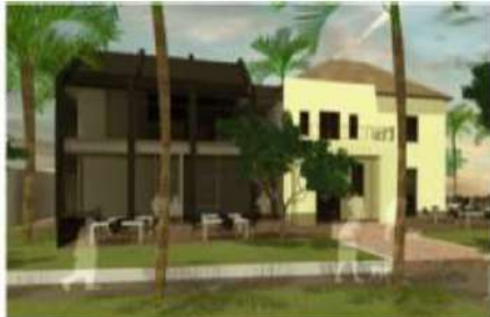
PROYECTO APROBADO 2017