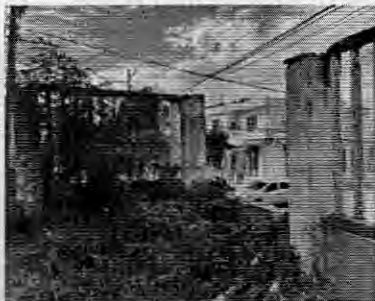
Foto Cerramiento del colegio