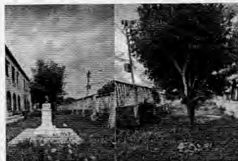
Foto zonas verdes

OBSERVACIONES: No hubo observaciones al proyecto.