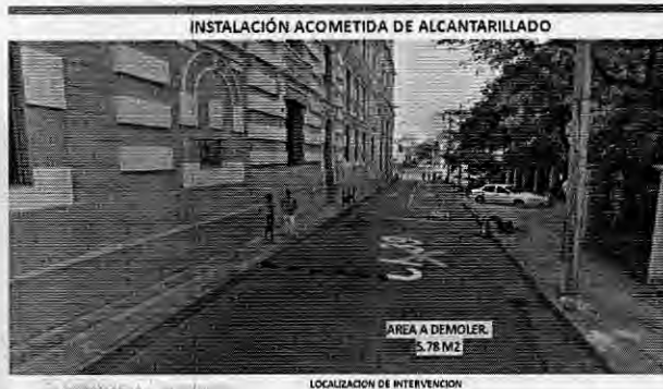
Foto Localización de intervención

Consiste en la Instalación de acometida de alcantarillado en C39 38 53/63, las obras a realizar son la demolición del pavimento, para instalar acometida de alcantarillado de 3 metros de largo y el área a demoler son 5.78 m2. Apertura de zanja manual.