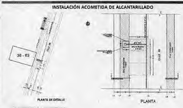
Foto Tramo de intervención