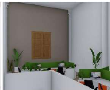
RENDERS PROPUESTO PARED MEZANINE