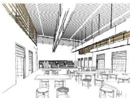
Imagen 21: Vista Interior zona Mariscos.