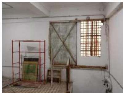
ESTADO ACTUAL PARED MEZANINE