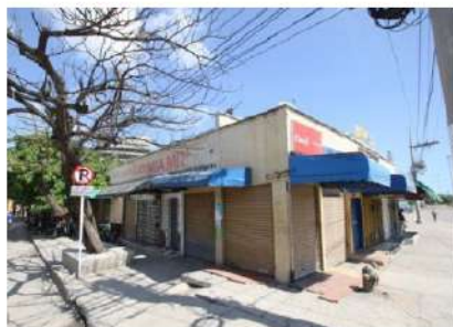
ESTADO ACTUAL MERCADO MIAMI II