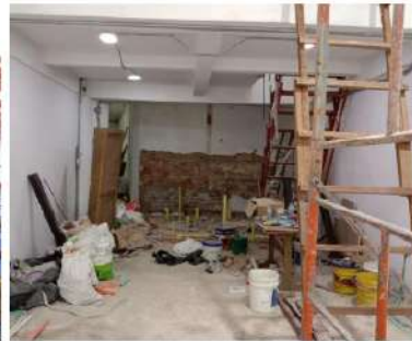
ESTADO ACTUAL BAÑOS LOCAL

En la siguiente imagen se muestra el estado actual y el render propuesto de los nuevos baños.