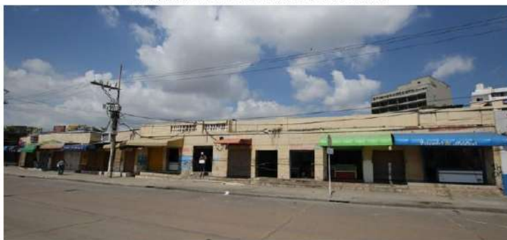
ESTADO ACTUAL FACHADA MERCADO MARISCOS