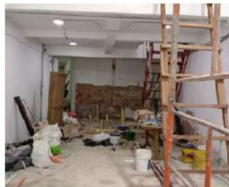
ESTADO ACTUAL BAÑOS LOCAL