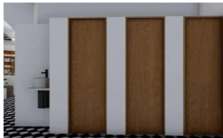
RENDERS PROPUESTO BAÑOS LOCAL