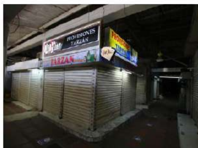
ESTADO ACTUAL MERCADO MIAMI II