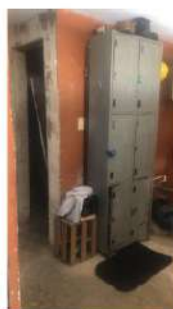
ESTADO ACTUAL PINTURA INTERIOR