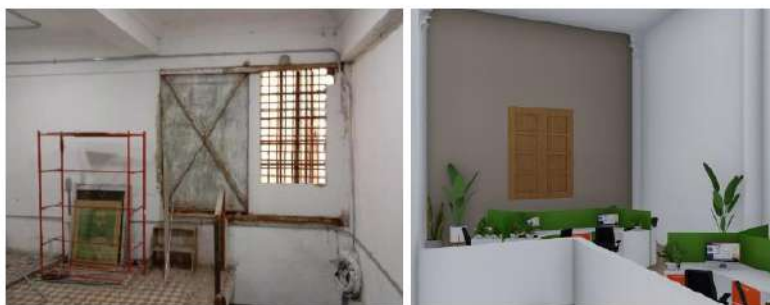
ESTADO ACTUAL PARED MEZANINE