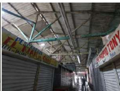
ESTADO ACTUAL MERCADO MARISCOS

El proyecto, va encaminado a mejorar las instalaciones de los mercados, que prestan un servicio a la comunidad y a los mismos usuarios. El propósito es rehabilitar el mercado Miami II, el cual se encuentra abandonado, las colmenas cerradas, las cuales son utilizadas como depósitos. El Mercado de Mariscos, funciona actualmente, pero con instalaciones en muy precarias condiciones físicas.