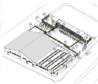
Imagen 22: Ventilación y Ubicación Cortasoles. Fuente EDUBAR S.A.