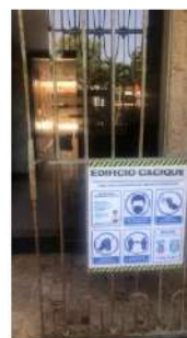
ESTADO ACTUAL DE REJAS

ALCALDÍA DE BARRANQUILLA | Soy BARRANQUILLA