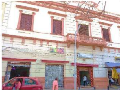
ESTADO ACTUAL FACHADA PRINCIPAL