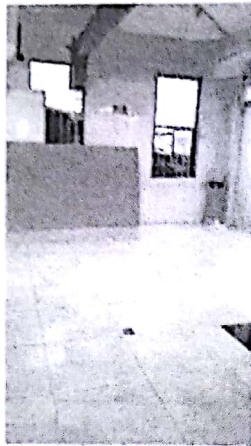
FACHADA INTERNA ACTUAL