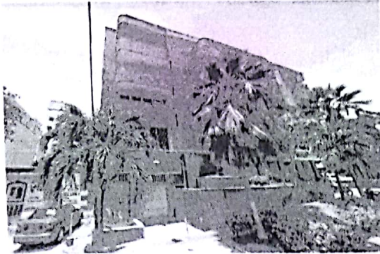
FACHADA EXTERNA ACTUAL