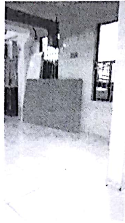
FACHADA INTERNA PROPUESTA

La propuesta consiste en la construcción de un auditorio sobre el costado norte en el segundo piso del inmueble existente. Contempla.