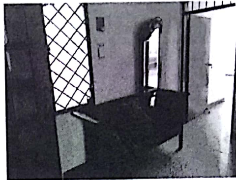
VISTA INTERNA ÁREA INTERVENIR DEL APTO 202

El proyecto contempla la modificación del vestíbulo existente del segundo piso del edificio residencial Aracayu, separando espacialmente los apartamentos 201 y 202.