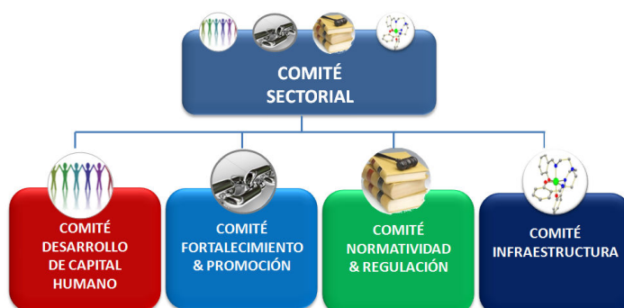
Estructura de comités para cada sector

Así, el equipo público-privado, con el apoyo de los diferentes comités en cada sector, se encarga de la ejecución de los planes de negocios sectoriales con el propósito de avanzar hacia el desarrollo de sectores de clase mundial.