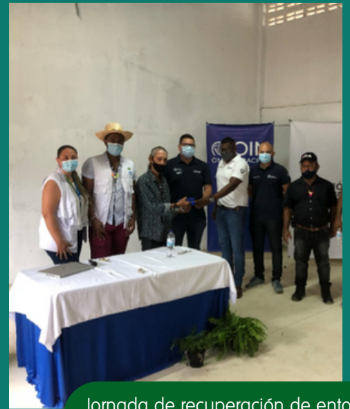
Jornada de recuperación de entornos seguros