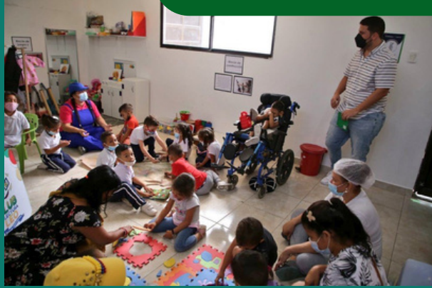
Jornada de Desarrollo Infantil en Medio Familiar (DIMF)