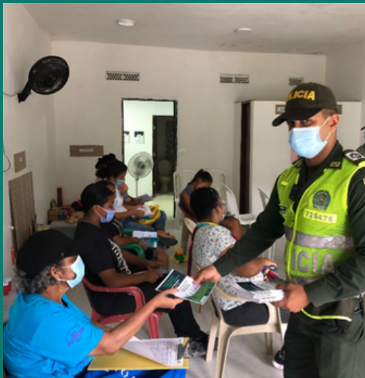
Jornada pedagógica: Socialización de Código de seguridad y convivencia ciudadana