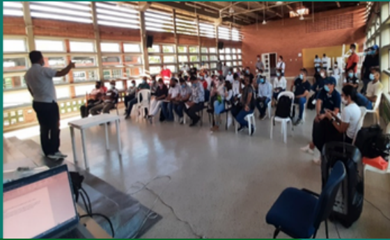
Socialización con pescadores y líderes comunitarios