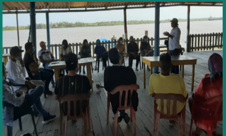
Mesa de trabajo con la comunidad, Dimar, Edubar, Centro de Oportunidades y otros.