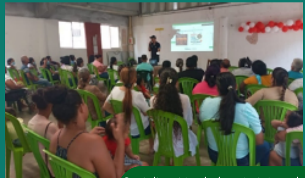
Socialización de la ruta integral en salud mental