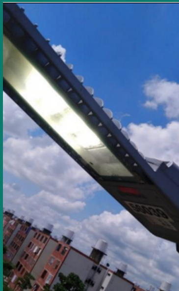
Reemplazo de luminarias deterioradas para aumento de la seguridad