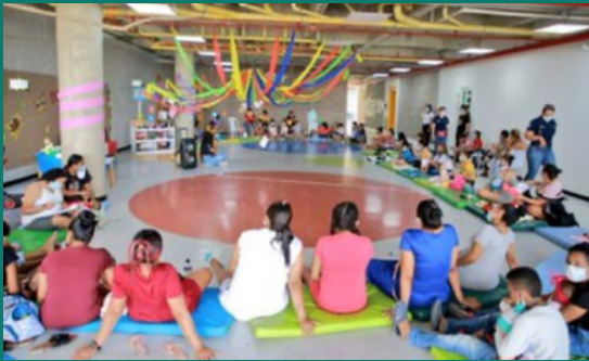
Actividades de desarrollo infantil en entorno familiar