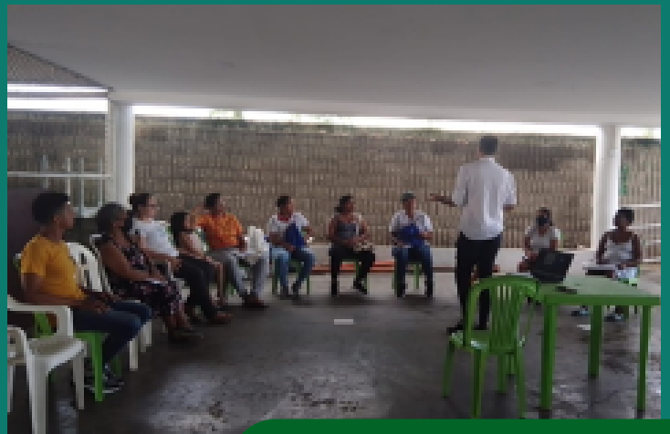
Capacitación sobre cuidados primarios en salud mental