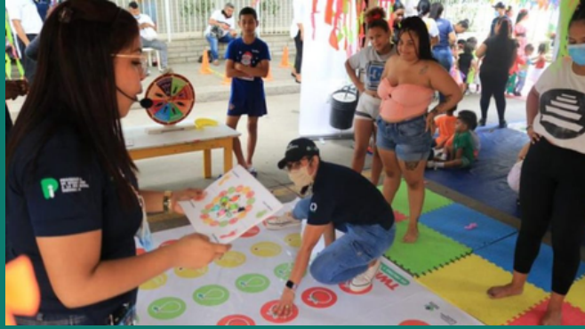
Jornadas lúdicas en Centros de Desarrollo Infantil