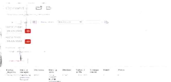
Herramienta de Reportes e Inteligencia de Negocios

Esta nueva herramienta está acompañada de un conjunto de aplicaciones de inteligencia de negocios, para realizar análisis de la información histórica y poder tomar decisiones basadas en las mismas en una sola herramienta.