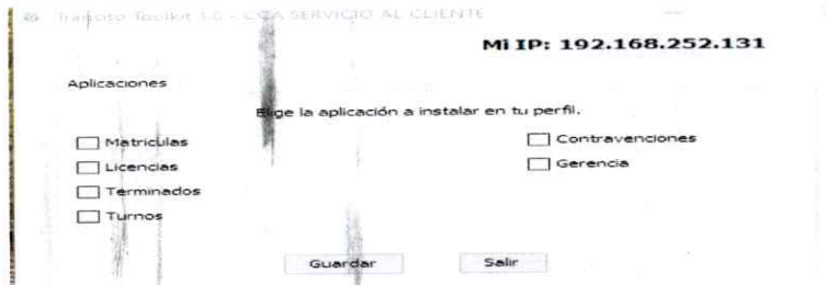
Desarrollo de Herramienta en Ventanilla.