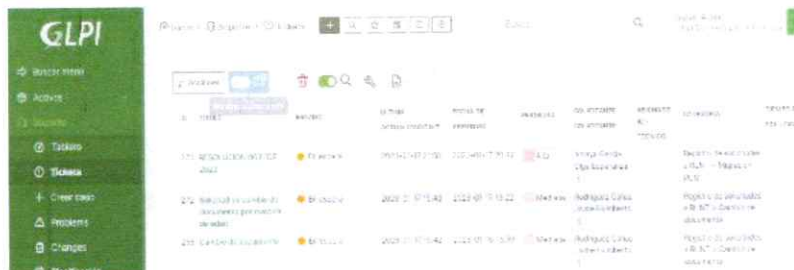
Desarrollo de Herramienta de Tickets.