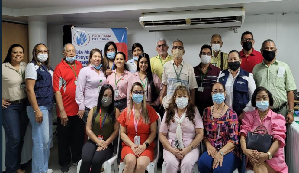
CLÍNICA GENERAL DEL NORTE CON LA ASOCIACIÓN DE USUARIOS