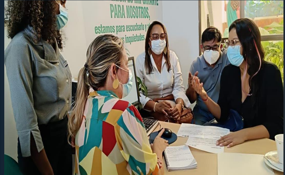
CLÍNICA LA ASUNCIÓN CON EL TALENTO HUMANO EN SALUD