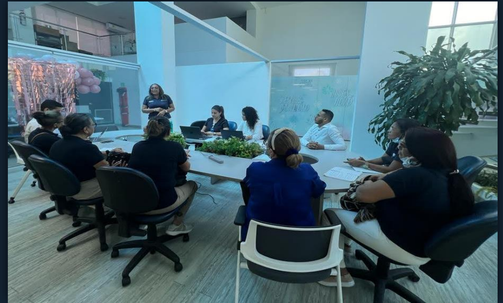
CLÍNICA BONNADONA CON LA ASOCIACIÓN DE USUARIOS