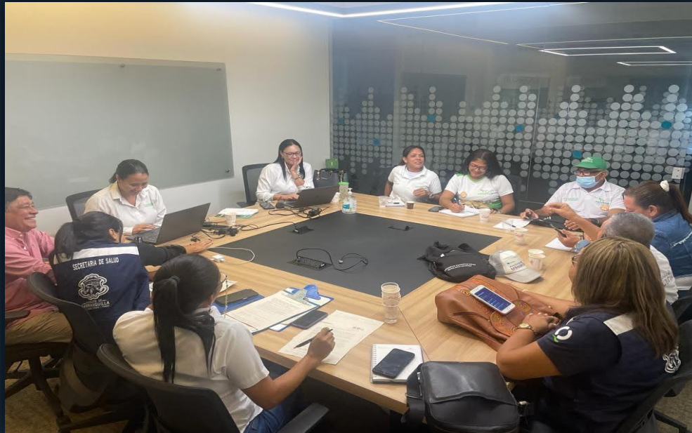
EAPB COOSALUD CON LA ASOCIACIÓN DE USUARIOS