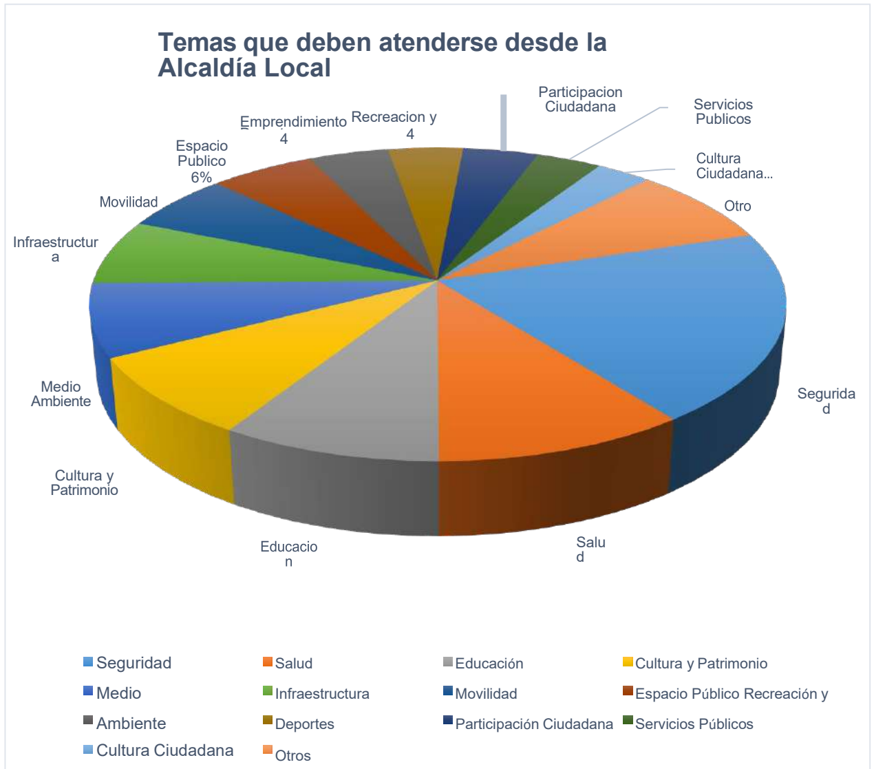
Grafico 3. Temas que deben atenderse desde la alcaldía local.

Artículo 3. DIAGNÓSTICO LOCAL: La localidad Norte Centro Histórico del Distrito Barranquilla es una de las cinco (5) localidades en que se encuentra dividida políticamente la ciudad de Barranquilla, la conforman 38 barrios y una población de 154.470 habitantes según Censo 2018 (DANE). Está ubicada dentro de los siguientes límites: al Nororiente con el río Magdalena; al Norte con la acera sur de la carrera 46 autopista el mar hasta la calle 84 siguiendo hasta la calle 82 con carrera 64 hasta empalmar con el río Magdalena y al Occidente con la avenida circunvalar incluyendo la zona de expansión urbana y rural.