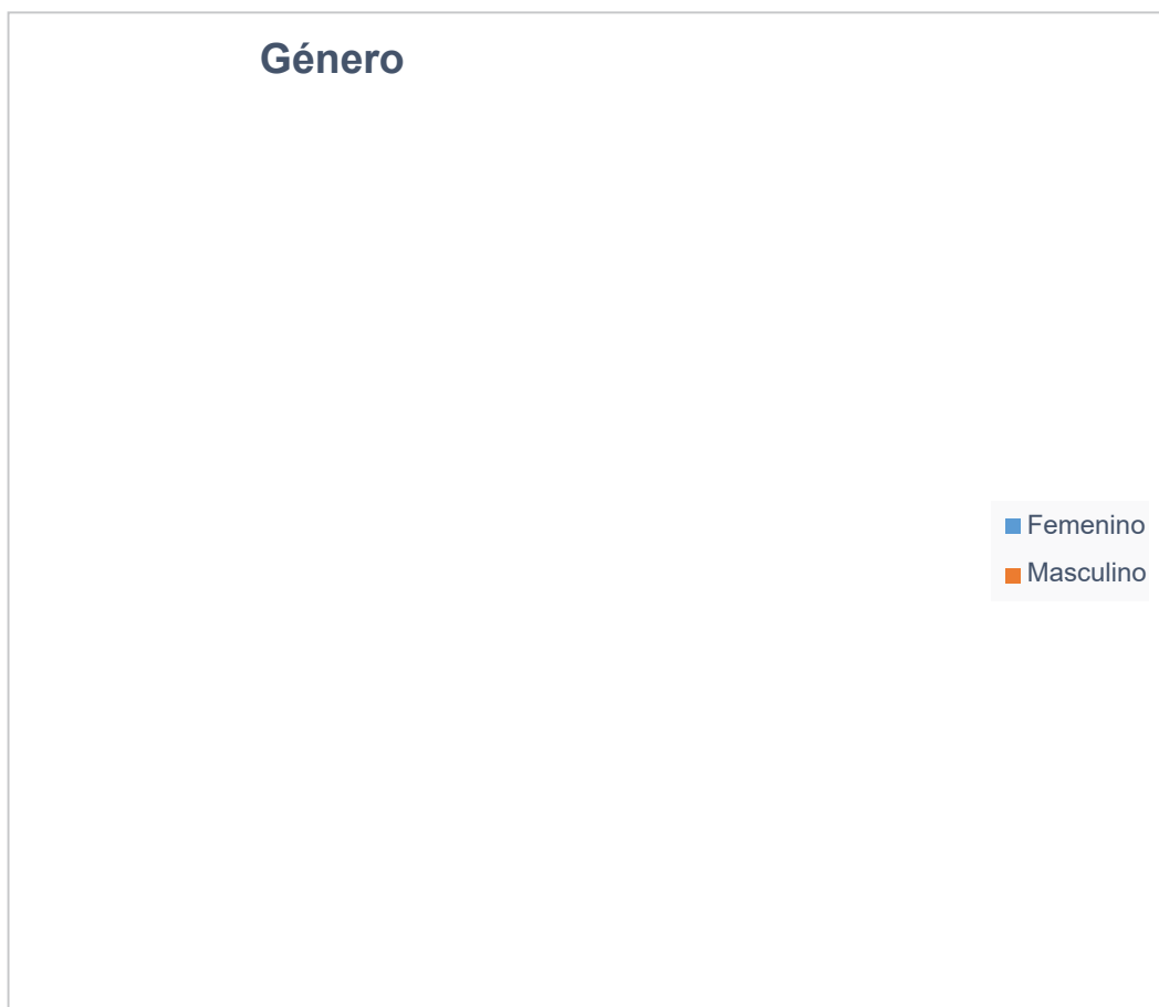
Grafico 1. Género de la población encuestada.