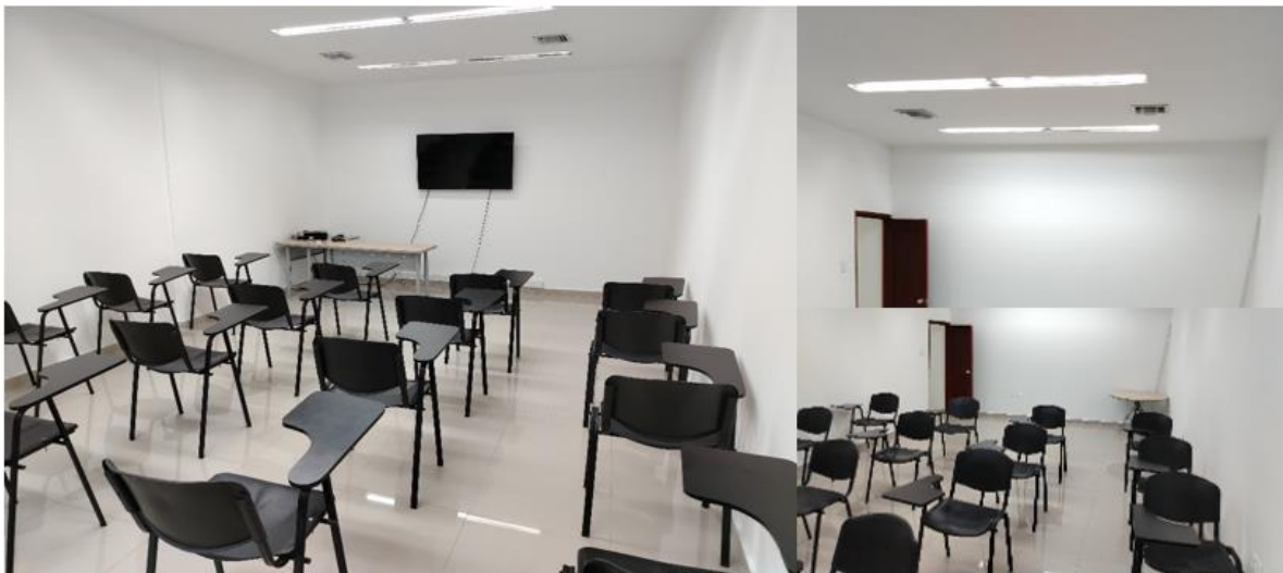
Imagen 2: Sede en proceso de certificación cc los Ángeles – Curso en normas de Tránsito ciudadanos infractores sede principal Secretaría Distrital de Tránsito y Seguridad Vial – Alcaldía Distrital de Barranquilla.