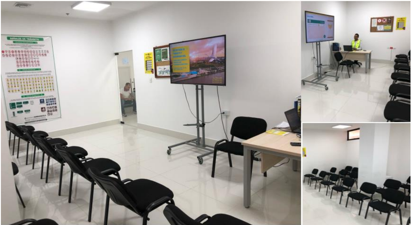
Imagen 1: Sede habilitada aplicativo RUNT – Curso en normas de Transito ciudadanos infractores sede principal Secretaría Distrital de Tránsito y Seguridad Vial – Alcaldía Distrital de Barranquilla.