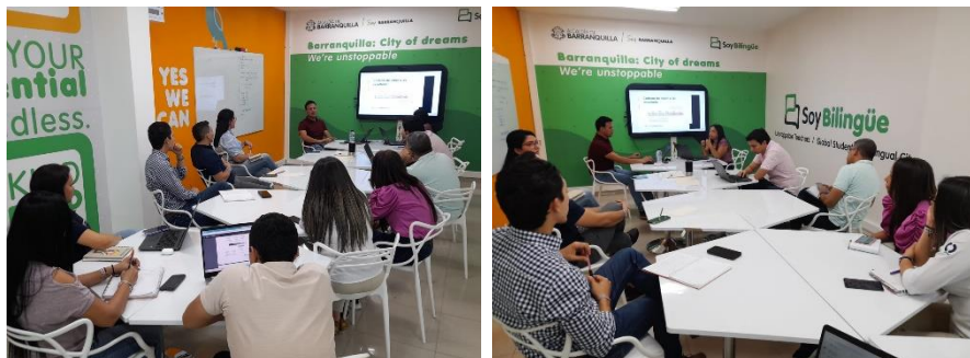
Reunión construcción indicadores

Indicadores de procesos se realizó revisión con los procesos de los que actualmente se están midiendo y se hizo el levantamiento y propuesta de nuevos con la finalidad que sean de impacto y ayuden a la toma de decisiones a su vez se recibió apoyo de un funcionario de la Secretaría Distrital de Planeación y se realizó socialización sobre Orientaciones generales para la construcción de Indicadores de procesos que aporten a la toma de decisiones, el monitoreo y medición del desempeño y logro de los objetivos de los procesos.