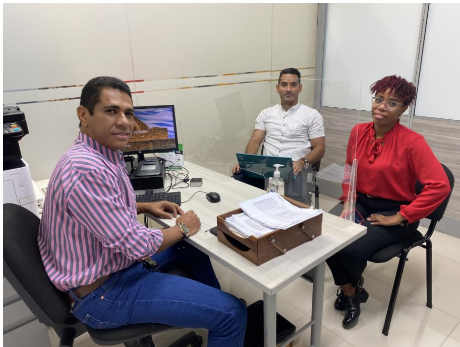
2. Auditoría con el coordinador de sede de cc Los Ángeles