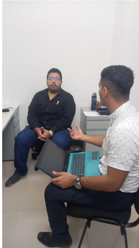
1. Auditoría auxiliar de impresión.