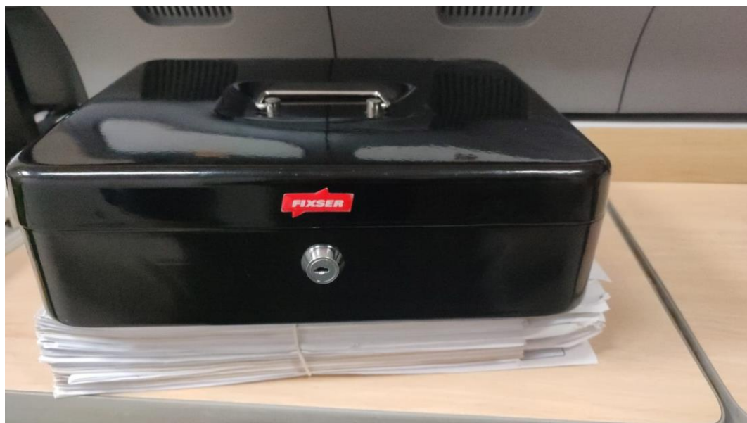
5. Evidencia de entrega de la asesora de oficina a los coordinadores de sede