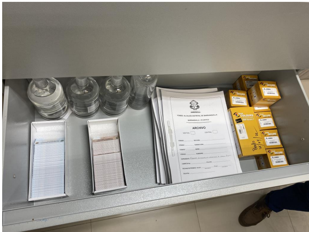
3. Archivar de coordinador de sede donde custodia especies venales

Fecha de Aprobación: 20/09-21 Versión: 2.2