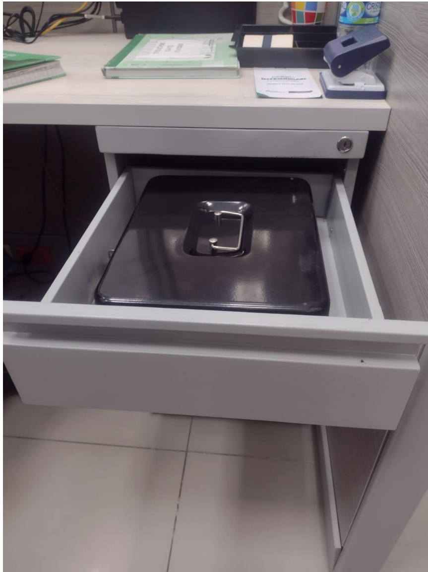
6. Cajas fuertes donde se custodian los sustratos.