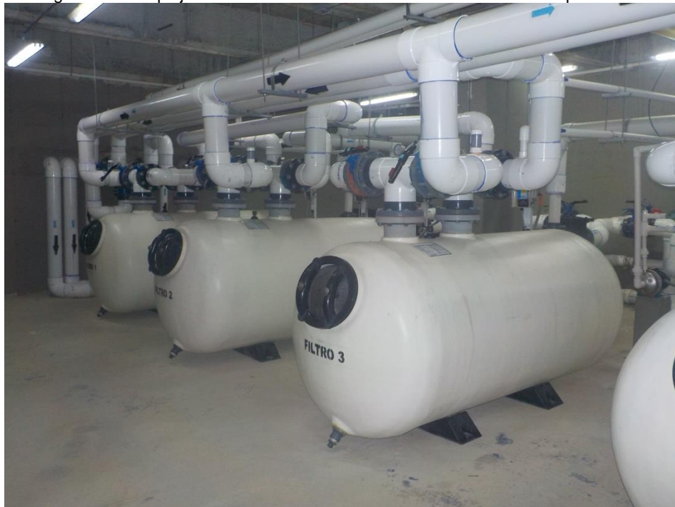
Fotografía 4. Complejo Acuático Eduardo Movilla - Sistema de Bombeo para Piscinas