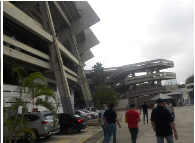
Fuente. Gerencia de Control Interno de Gestión - Registro Fotográfico Visita de Campo