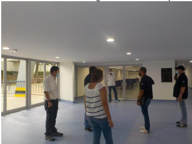
Fotografía 6. Estadio Metropolitano Roberto Meléndez – Infraestructura