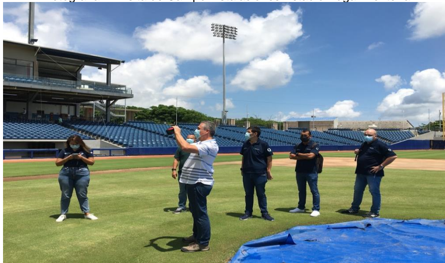
Fotografía 1. Visita de Campo Instalaciones Estadio Edgar Rentería