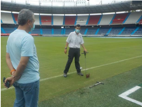
Fotografía 6. Estadio Metropolitano Roberto Meléndez