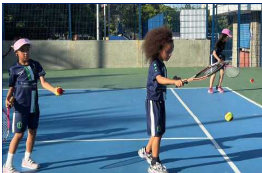
Niños de la Escuela de formación de TENIS