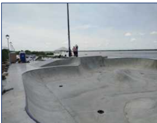
Zona bowl: Aproximadamente 436.91 m2. Consta de estructuras en concreto reforzado con especificaciones técnicas de alta resistencia, asegurando durabilidad y calidad.

A continuación, se presentan el registro fotográfico de los avances de la obra hasta la fecha del presente informe