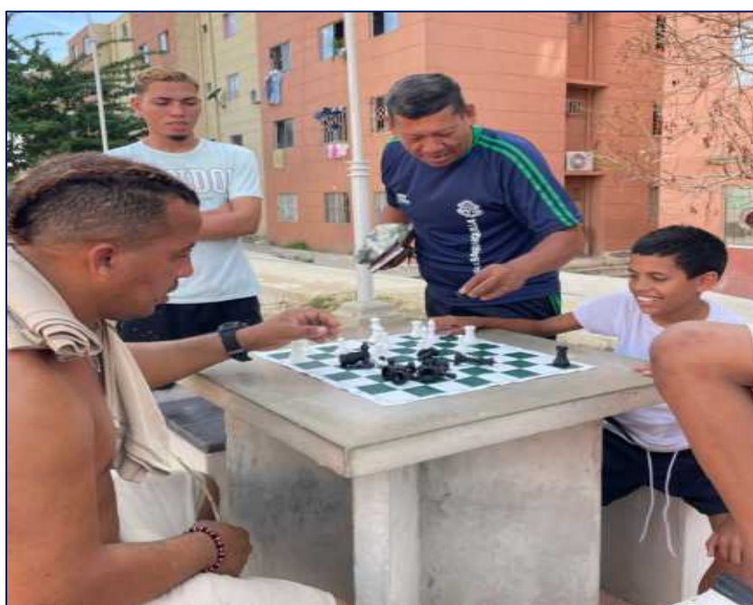
Clases de ajedrez a los jóvenes de Villas de la Cordialidad