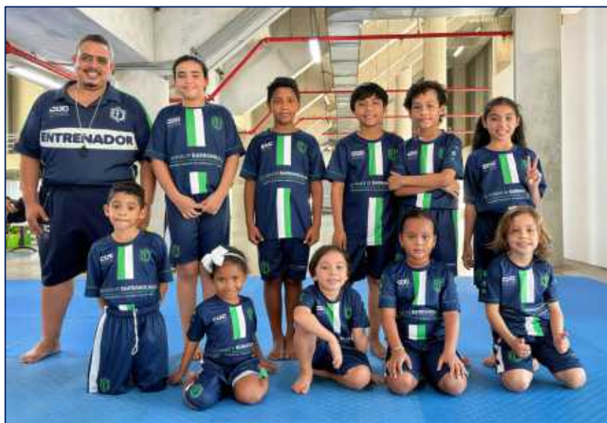
Niños, niñas y adolescentes escuela de formación de KARATE