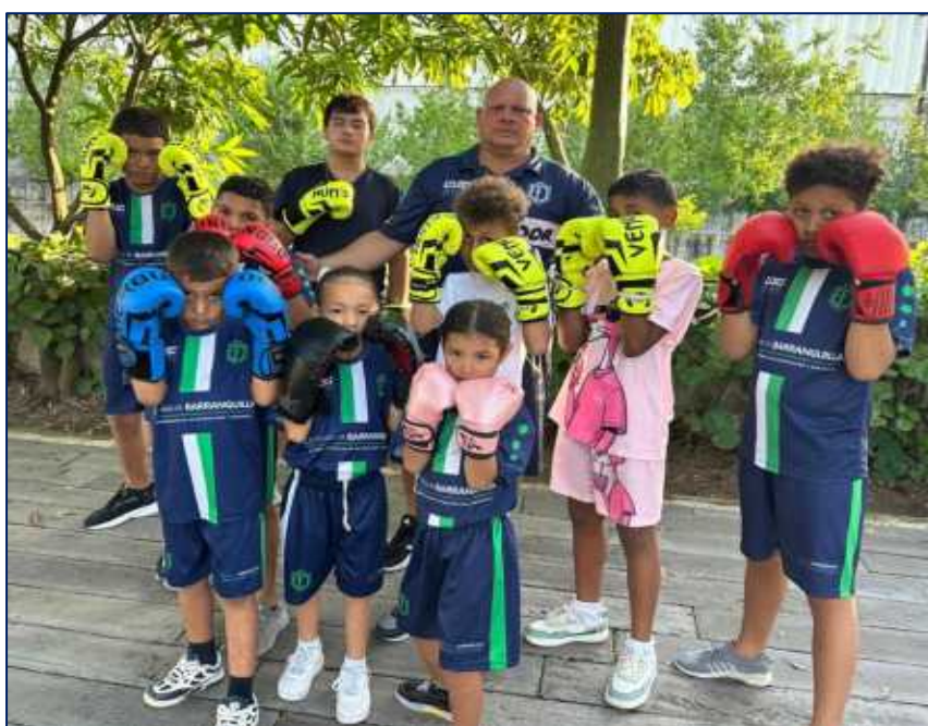
Grupo de niños y niñas inscritos en BOXEO