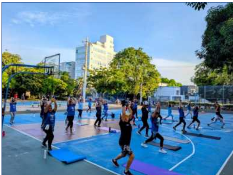
Beneficiarios del proyecto de actividad física Muévete a otro nivel