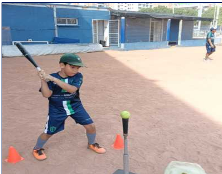
Niño en sus clases de BEISBOL