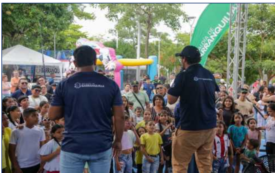
Momentos donde los niños, niñas, jóvenes, adultos disfrutaban de las actividades, juegos y rifas de la estrategia Más Recreación en familia