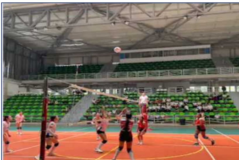
Encuentro juegos intercolegiados de voleibol femenino

Este proyecto ha facilitado la participación de más de 7,000 jóvenes en competencias deportivas, creando un ambiente de sana competencia y camaradería. Los Juegos Intercolegiados no solo fomentan el desarrollo físico, sino que también impulsan la participación y el sentido de pertenencia entre los estudiantes de diversas instituciones educativas. La infraestructura y organización de los eventos han garantizado que cada disciplina deportiva se desarrolle en óptimas condiciones, consolidando la importancia del deporte escolar en la formación de futuros atletas.