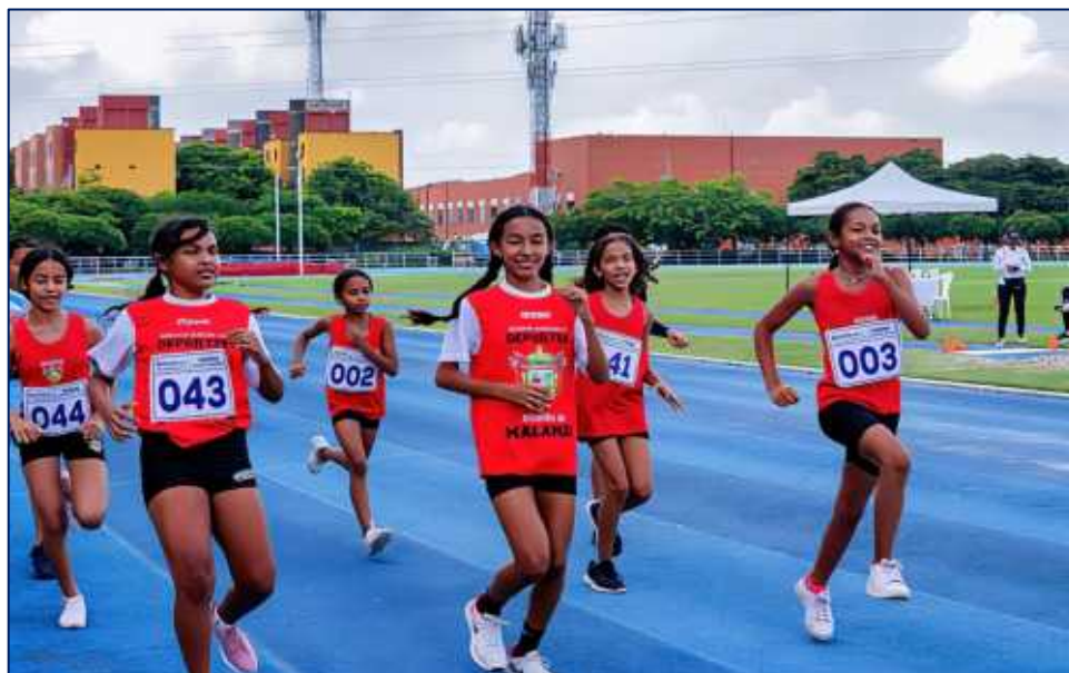
Interlocalidades de Atletismo en el Estadio Rafael Cotes