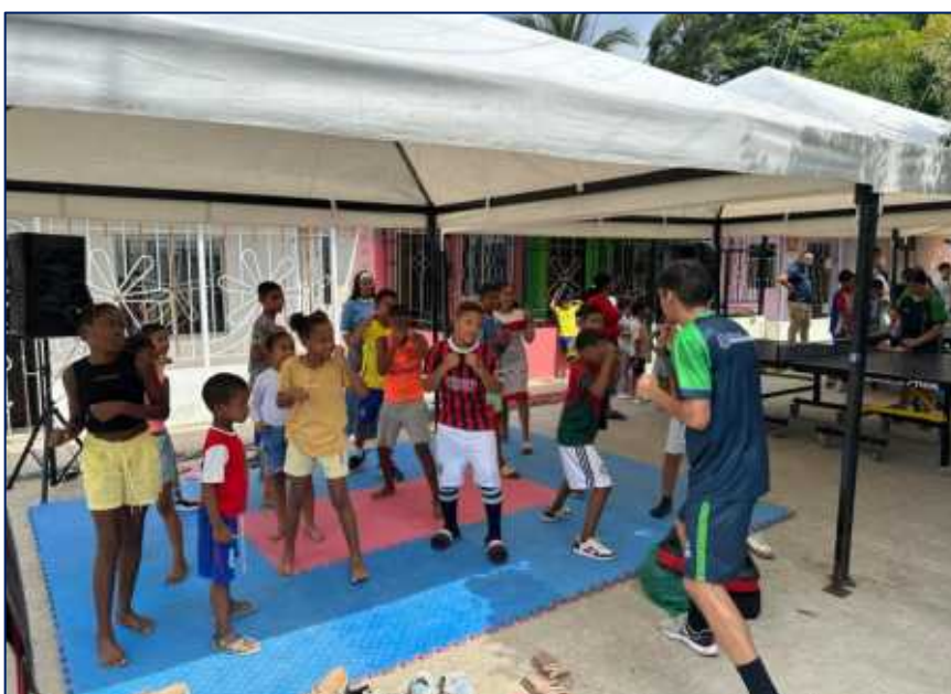
Niños, niñas y adolescentes practicando boxeo