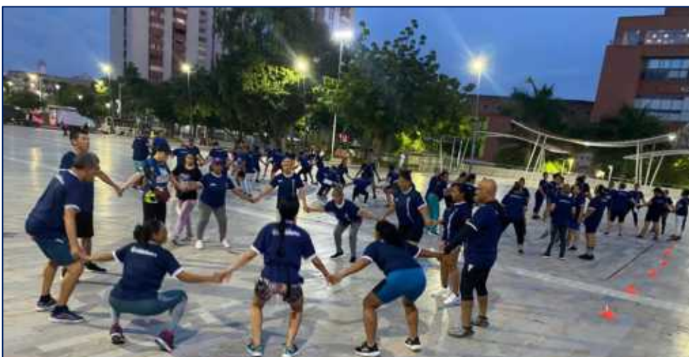
Grupo de personas de 14 años en adelante participantes de la estrategia deporte recreativo