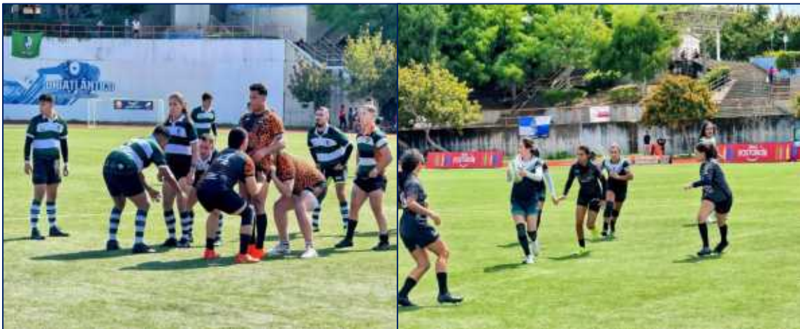
Imágenes del desarrollo del torneo Internacional de Rugby “Sebastian Palacios Zapata” realizado el pasado 16 y 17 de agosto, el cual contó con la participación de 19 equipos provenientes de diversas regiones del país y de Guatemala.