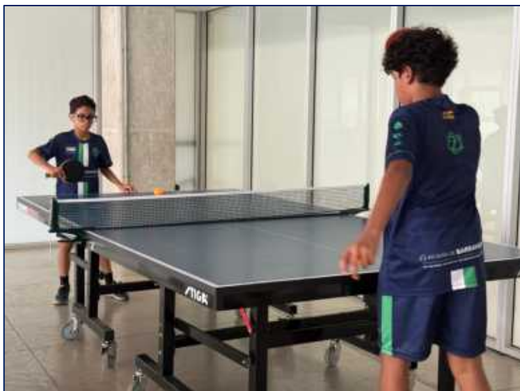
Niños recibiendo clases de TENIS DE MESA