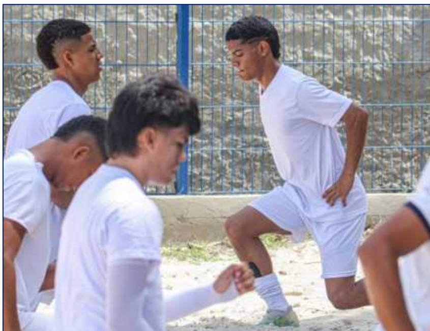
Grupo de jóvenes en su etapa de entrenamiento deportivo de fútbol