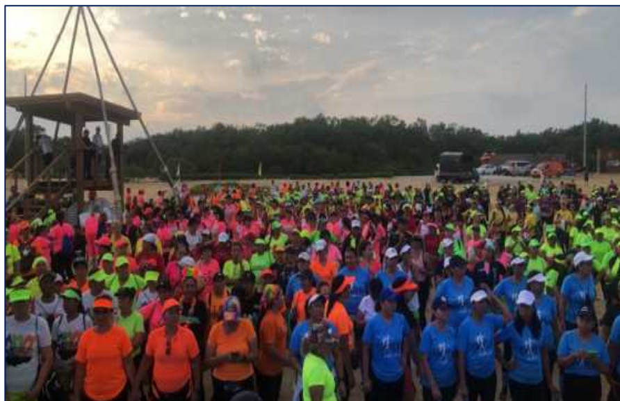
Supersesión de actividad física realizada en Puerto Mocho