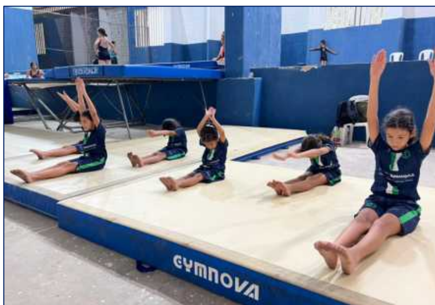
Niños y niñas en práctica de GIMNASIA