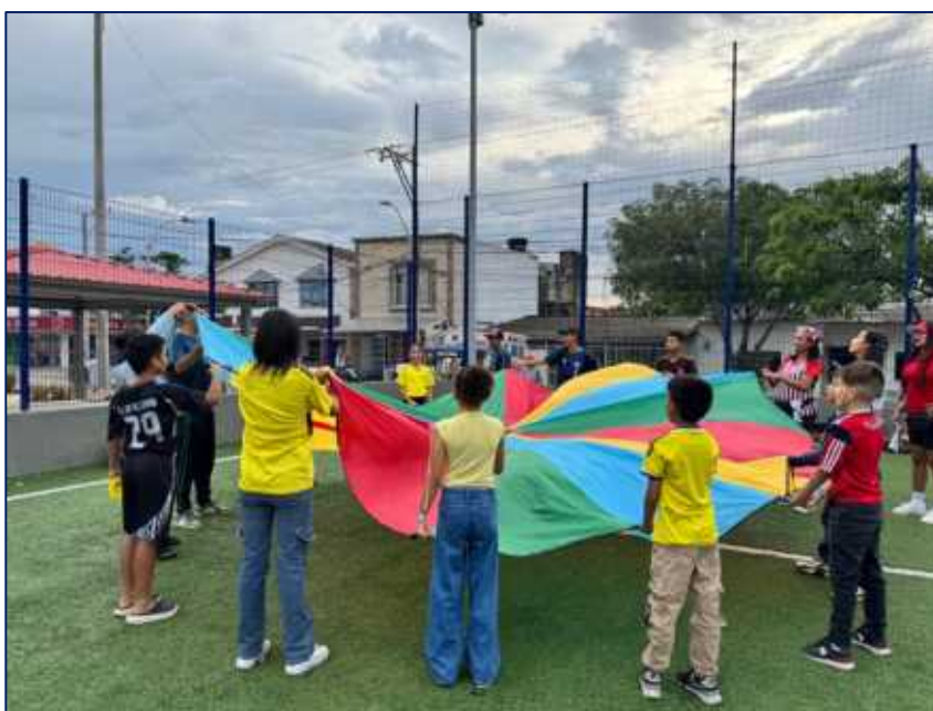
Juegos de integración para chicos y grandes