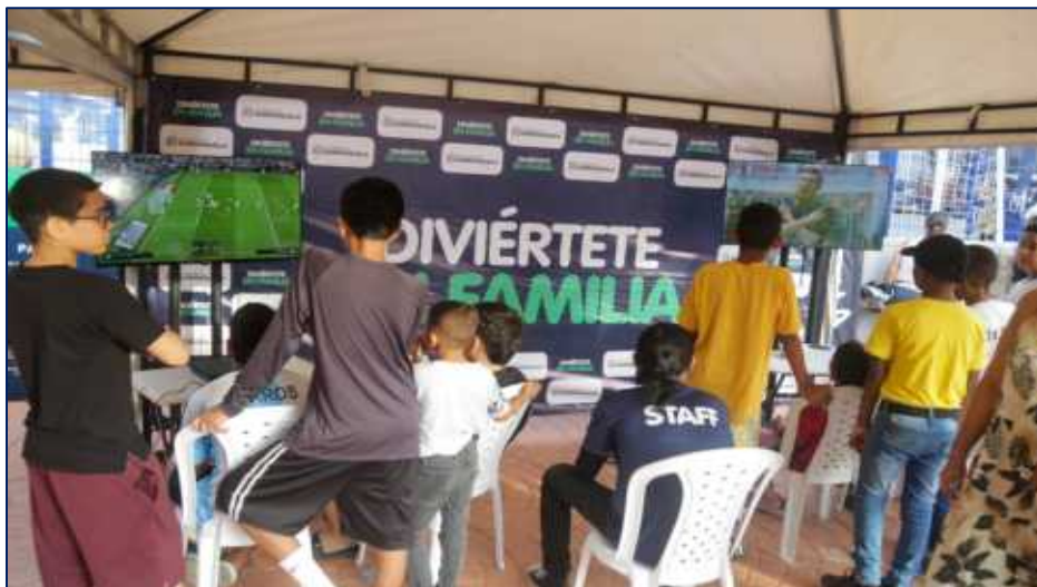
Niños y jóvenes disfrutando de la zona de deportes electrónicos

Más Recreación en Familia Inversión: 2.000 MM Beneficiarios: 4.650