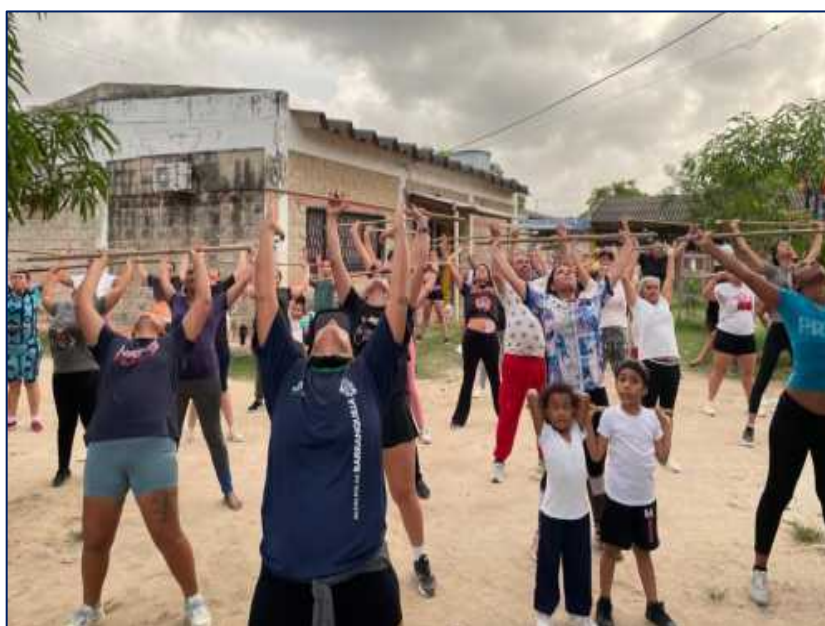
Jornada de rumbaterapia dirigida a la comunidad de Pinar del Río