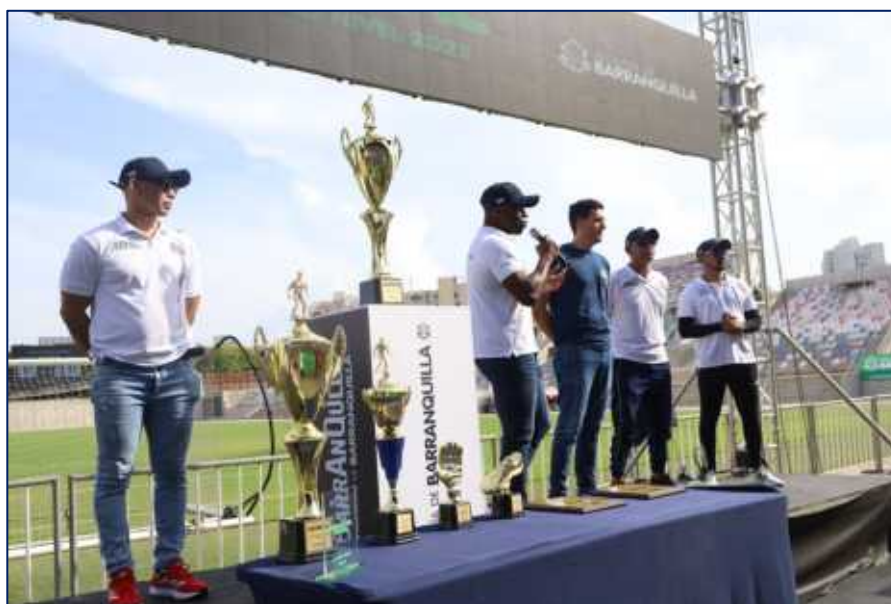
Secretario de Recreación y deportes y grupo de entrenadores momentos de la premiación del torneo de Fútbol a otro nivel