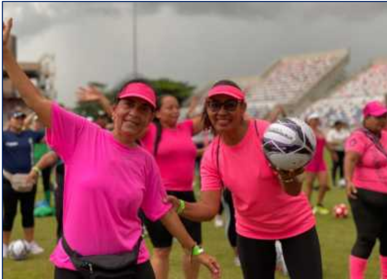
Beneficiarias de la estrategia para la promoción de la actividad física-Fitness

Actividad física tipo fitness Inversión: 600 MM Beneficiarios: 3.441