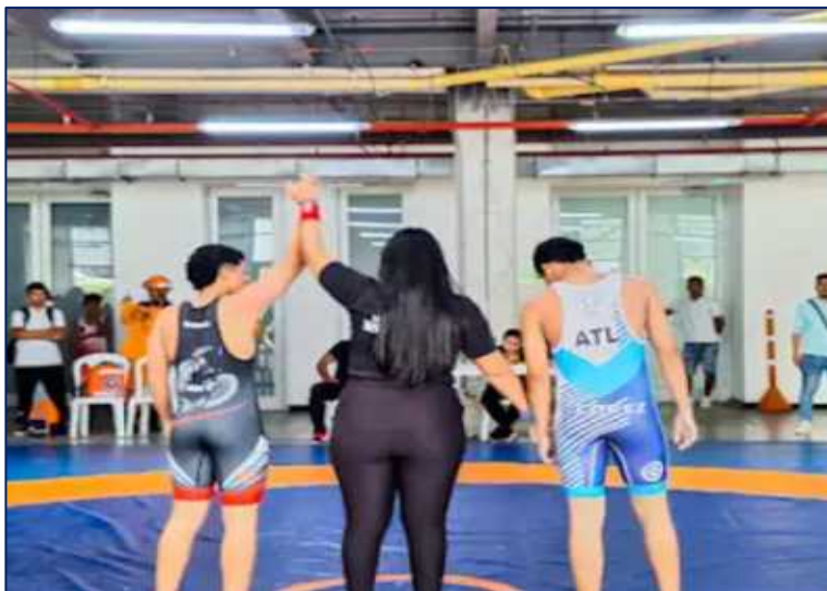
Participantes en la disciplina juvenil masculina de Lucha-Juegos Intercolegiados