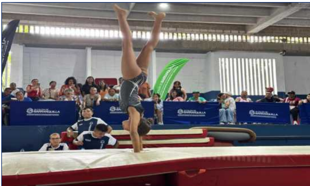
Niña demostrando sus habilidades en la disciplina de Gimnasia