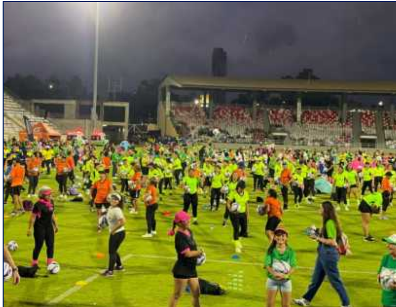
Participantes de Gran jornada de fitness en el Estadio Romelio Martínez