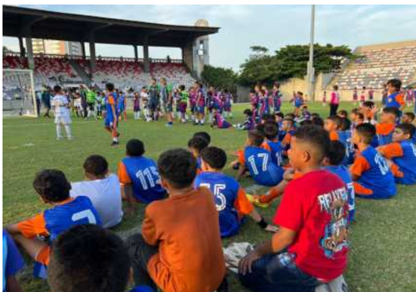
Grupo de niños vinculados la estrategia Jugando por un futuro a otro nivel en sus prácticas deportiva