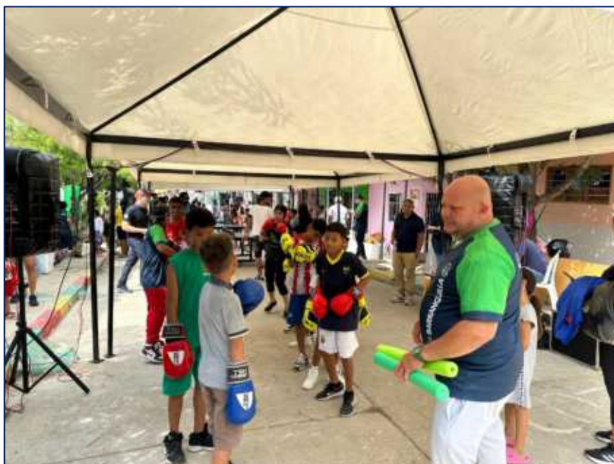
Grupo de niños participantes de la actividad practicando boxeo