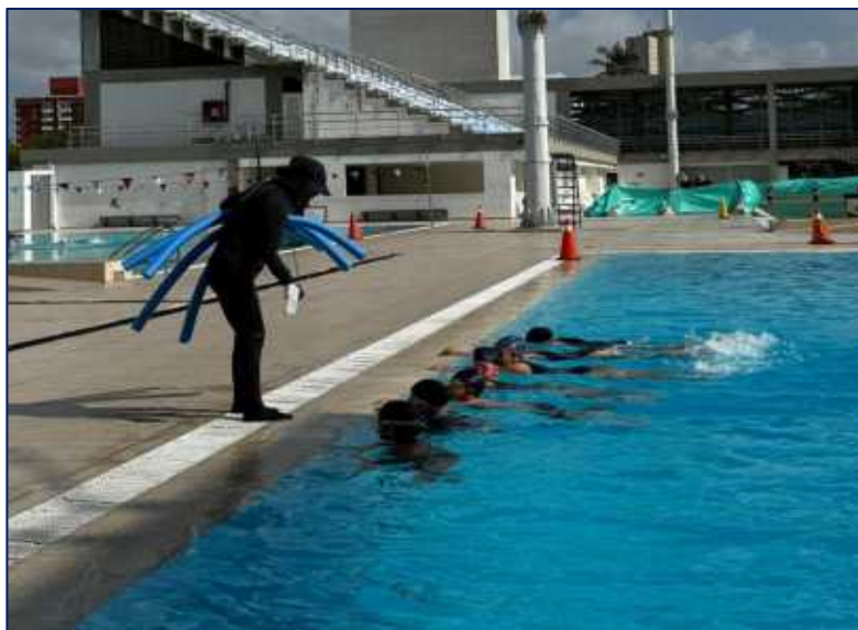
Niños en clases de NATACIÓN en el Complejo Acuático Eduardo Movilla