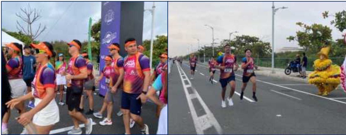
Participantes de la V edición de la Carrera Fula Run