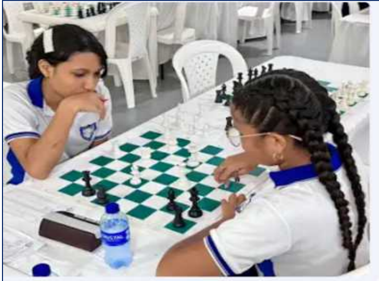
Competencia de ajedrez en el marco de los Juegos Intercolegiados- fase distrital