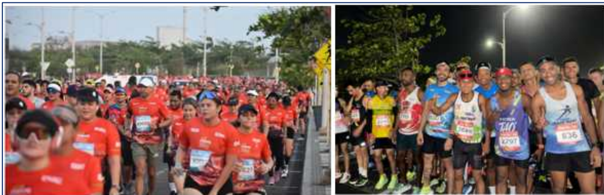
Atletas participantes de la Maratón de Barranquilla 2.025 realizada el 23 de marzo de 2025