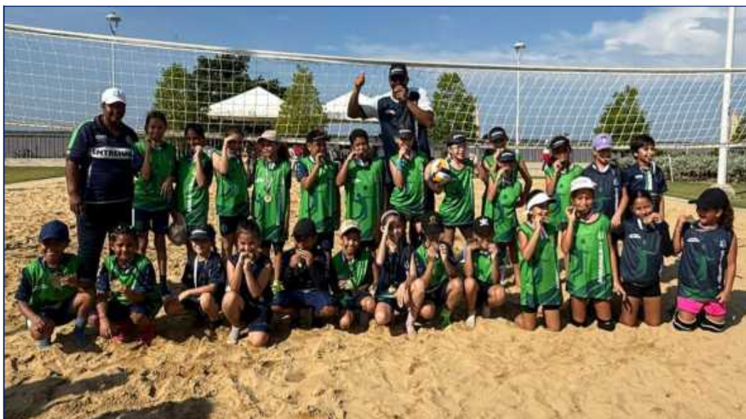
Participantes de Voleyplaya en las canchas del Gran Malecon del Rio