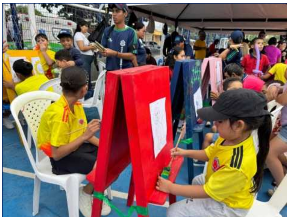
Niños, niñas disfrutando de la variedad de actividades de aprovechamiento del tiempo libre