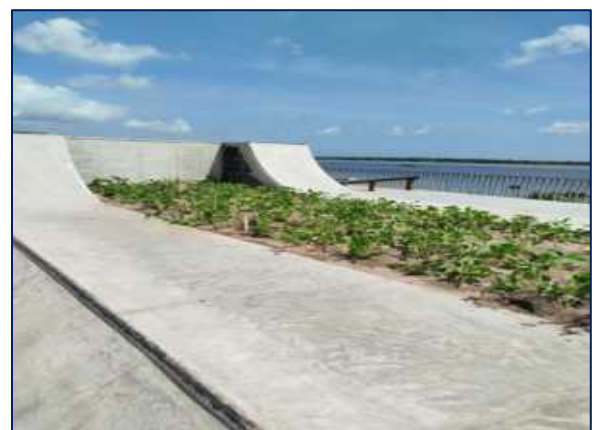
Zona Street: Cuenta con un área aproximada de 457.98 m2. Adicional a todas las actividades de obra civil realizadas, hay espacios para el urbanismo y paisajismo.