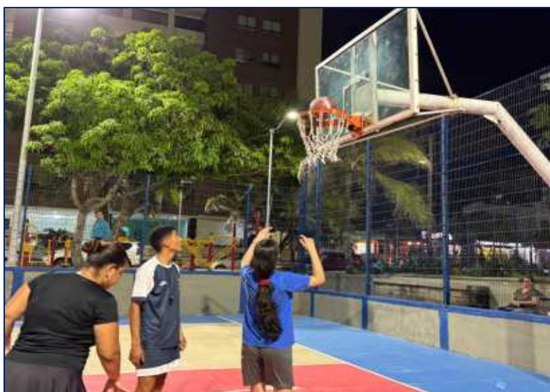
Jóvenes en formación de BALONCESTO