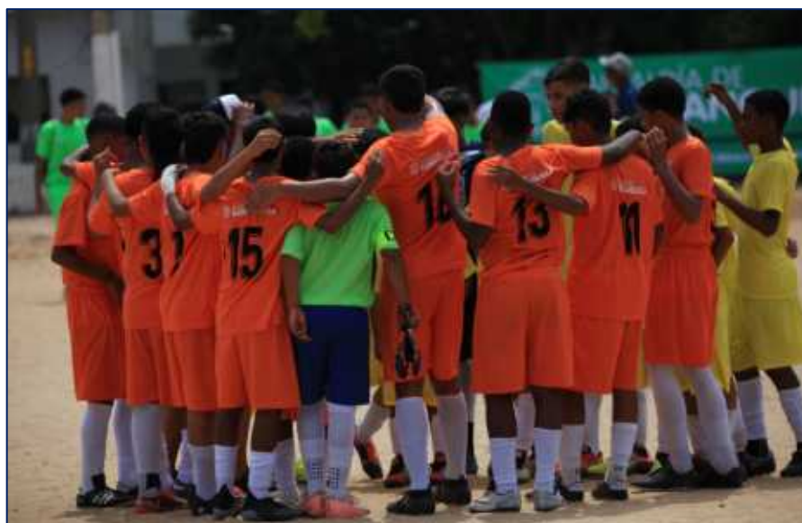
Equipo de fútbol momentos previos al encuentro deportivo