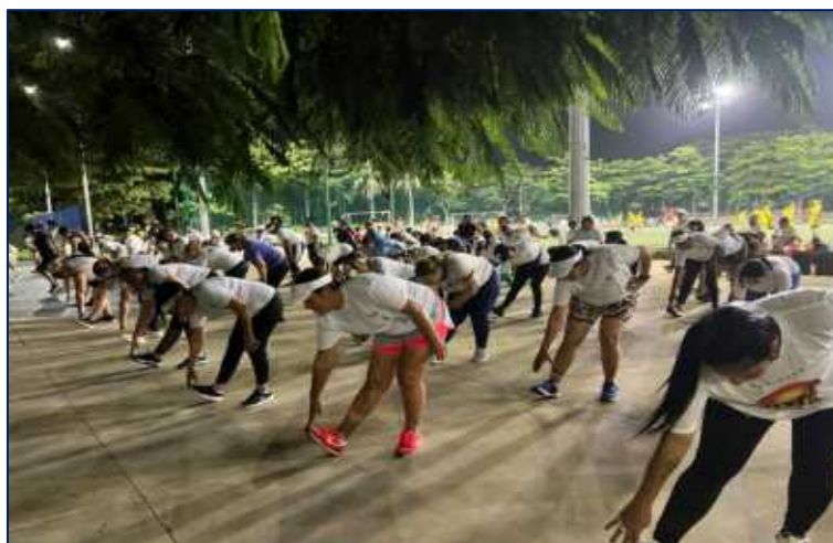
Grupo de actividad física regular en jornada nocturna