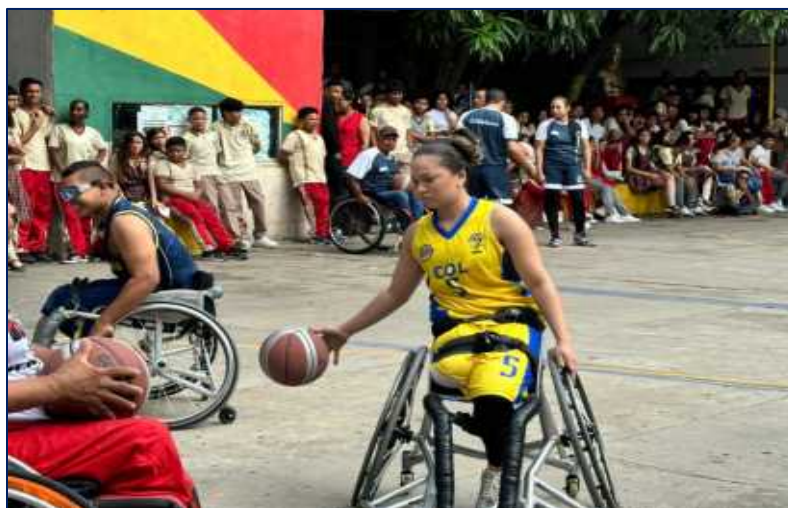
Jóvenes con discapacidad física Baloncesto en silla de ruedas