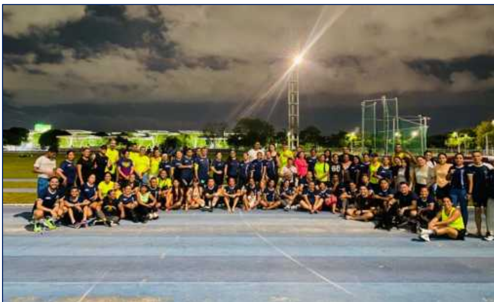
Entrenamiento de atletismo estrategia deporte recreativo

Deportes recreativos Inversión: 2.500 MM Beneficiarios:2.097