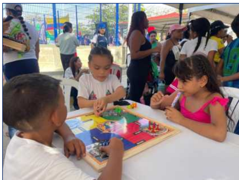
Rescatando los juegos tradicionales, niños y niñas jugando parques