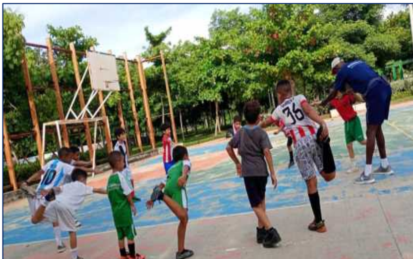
Niños, niñas y adolescentes entrenando fútbol en Villas de San Pablo

Deporte para todos Inversión: 1.000 MM. Beneficiarios: 1.090.