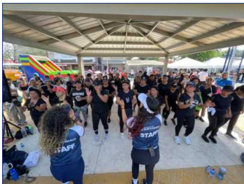
Momentos donde las jóvenes, adultas y personas mayores también tuvieron su espacio con una sesión de rumbaterapia