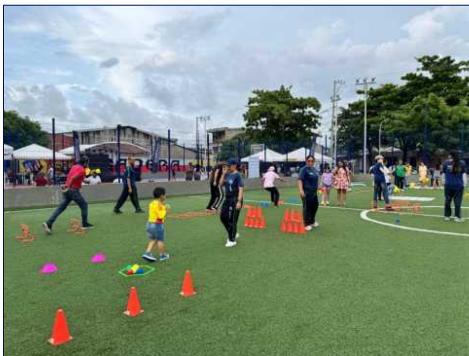
Actividades recreativas adaptadas

El desarrollo del programa “Más Deporte para Todos” representó un pilar esencial en la construcción de una Barranquilla más inclusiva y activa. A través de sus diversos proyectos, se fortalecieron las escuelas de formación deportiva, se promovieron prácticas recreodeportivas en todas las localidades y se garantizó la participación de poblaciones con enfoque diferencial, como personas con discapacidad. Las estrategias implementadas lograron impactar a miles de ciudadanos, generando espacios de aprendizaje, integración y convivencia. Además, los Juegos Intercolegiados se consolidaron como una plataforma para fortalecer la identidad deportiva estudiantil. La infraestructura existente fue clave en la ejecución de estas actividades, permitiendo un despliegue eficiente de torneos, festivales y encuentros. Este programa no solo potenció las habilidades físicas, sino también valores como el respeto, la disciplina y el trabajo en equipo. El enfoque territorial permitió llevar el deporte a cada rincón de la ciudad. En conjunto, “Más Deporte para Todos” fortaleció el tejido social y elevó el bienestar de la comunidad