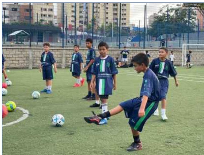
Grupo de niños practicando FUTBOL