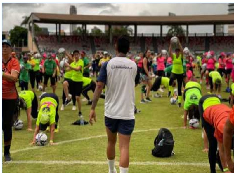
Participantes de la Gran jornada de fitness en el Estadio Romelio Martínez