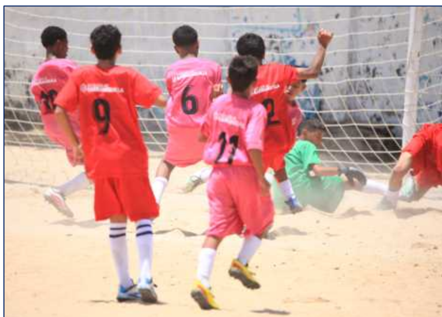
Equipo de fútbol en encuentro deportivo