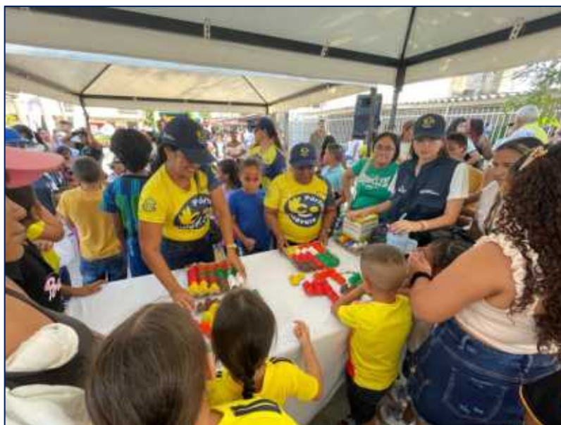
Juegos de integración entre los niños, niñas y los padres asistentes

Jornadas recreativas Inversión:600 MM Beneficiarios: 810