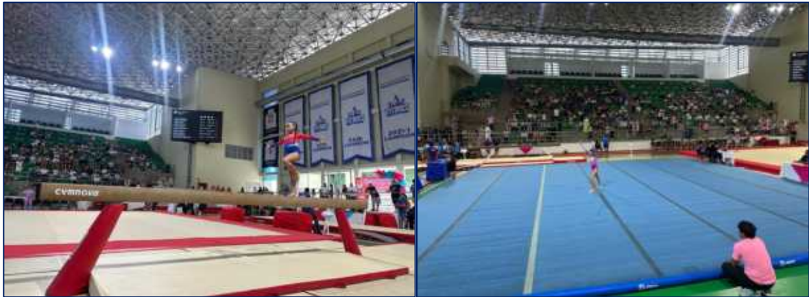
Deportistas femeninas realizando su presentación en el festival Nacional de Gimnasia Artística