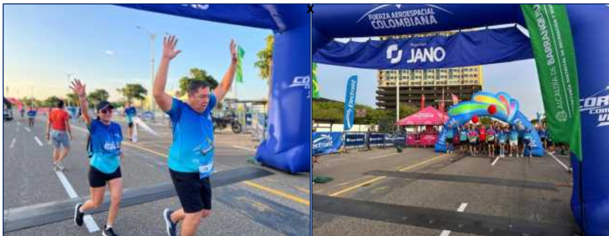
El pasado 24 de agosto se realizó len el gran malecon la Carrera corre ccomo el viento en conmemoración de los 106 años de la FAC, evento que busca la integración familiar y el fomento de hábitos y estilos de vida saludable