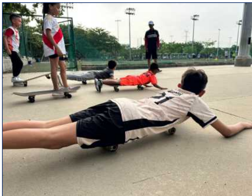
Niños y niñas aprendiendo SKATEBOARDING