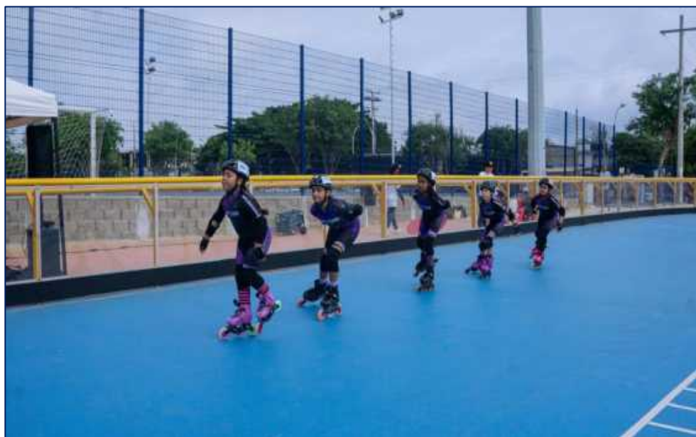
Niñas participantes del torneo Interlocalidades de patinaje pista de la Magdalena

Torneo interlocalidades: Inversión: 3.500 MM Beneficiarios: 2.300