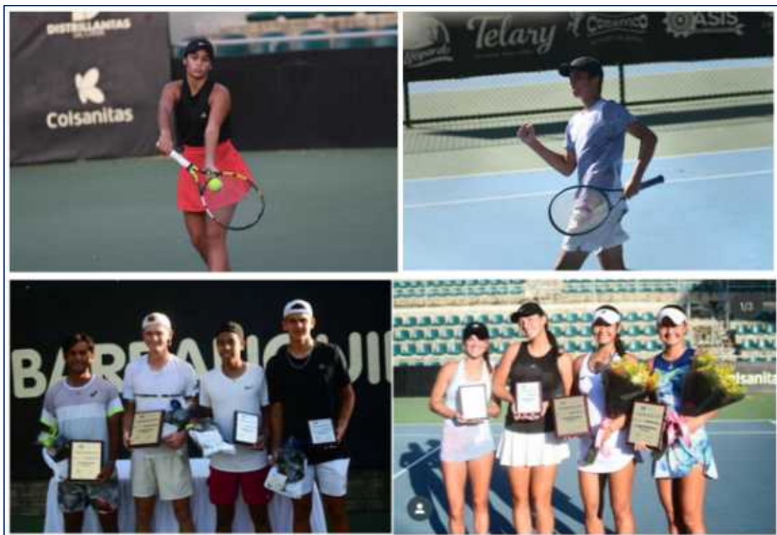
Ganadores de la edición 42 del Mundial Juvenil de Tenis J300" Copa Barranquilla 2.025