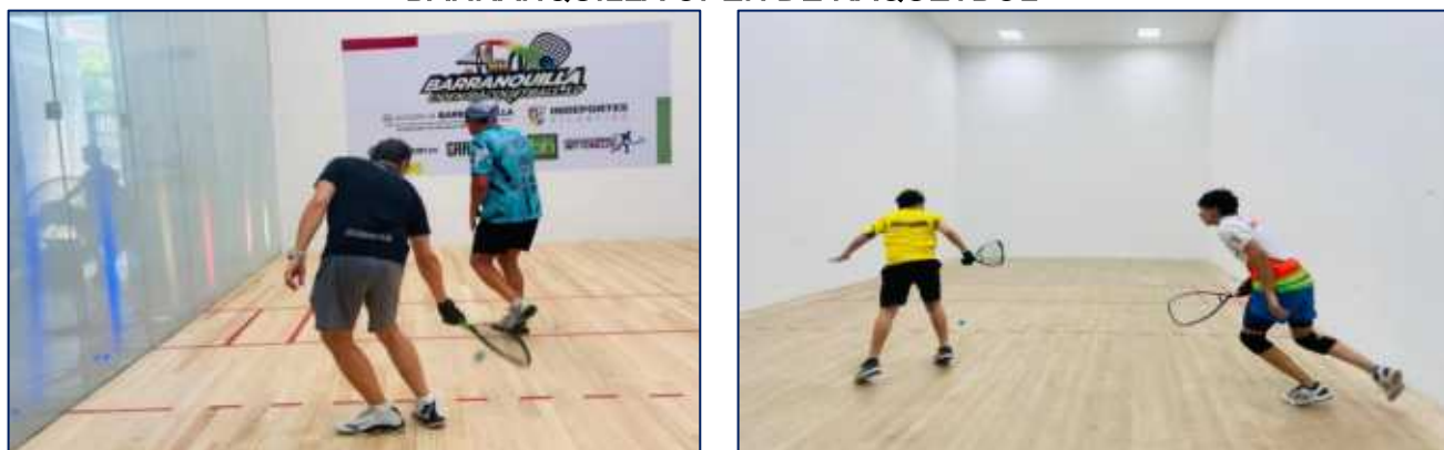
Este evento internacional reunió a atlas de de México, Estados Unidos, Bolivia, República Dominicana, Costa Rica, Guatemala y Colombia