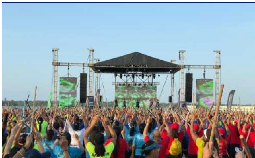
Participantes de la supersesión de actividad física en el Gran Malecón