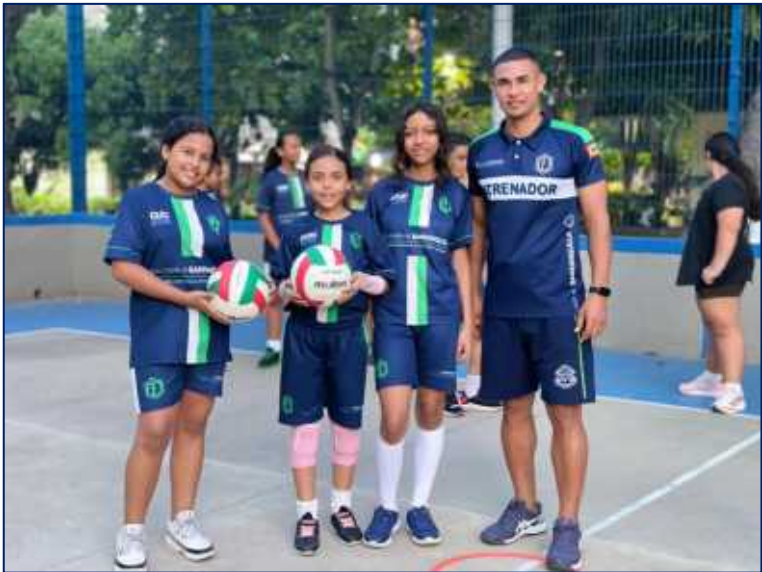
Niñas practicantes de Voleibol

A continuación, se presenta el registro fotográfico de los niños, niñas, adolescentes participantes del proyecto de Escuelas de formación deportiva en los diferentes deportes y utilizando los escenarios deportivos del distrito.