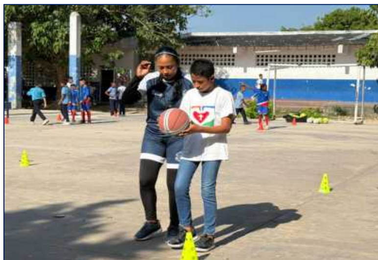
Niño con discapacidad visual aprendiendo a jugar baloncesto