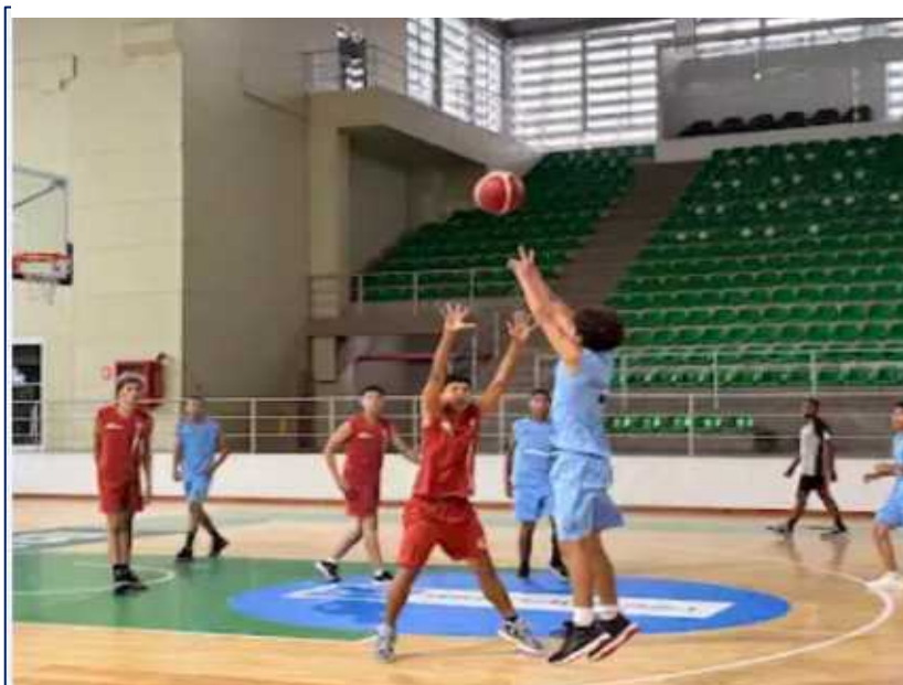
Intercolegiado de baloncesto juvenil masculino Estadio Elías Chewing