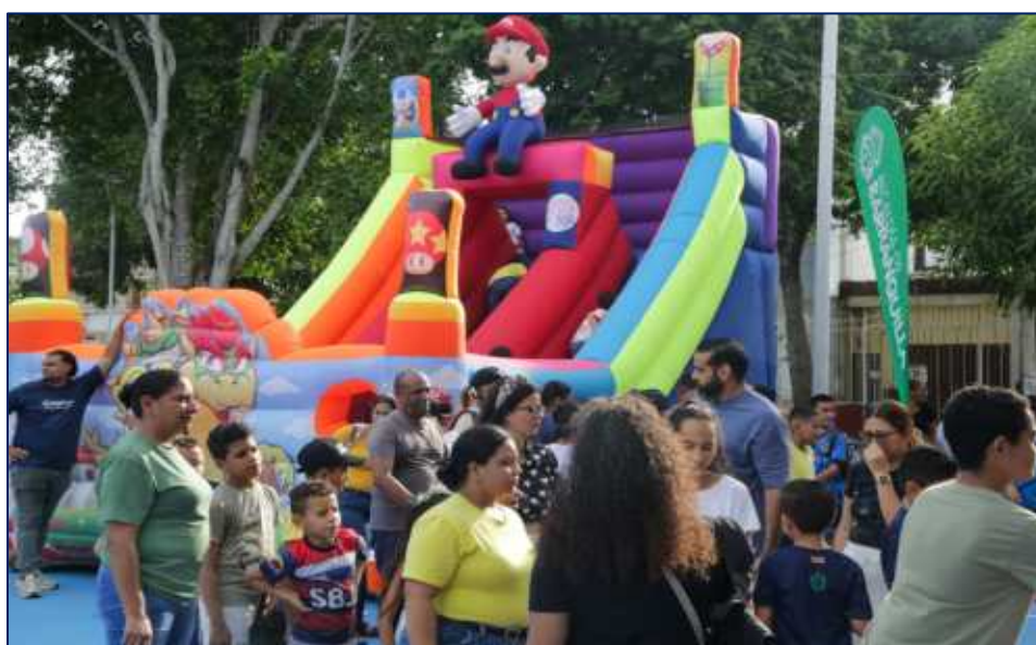
Niños y niñas jugando en los inflables