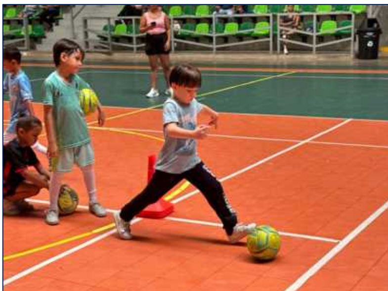
Niños en clases de FUTBOL SALA en el Coliseo Sugar Baby