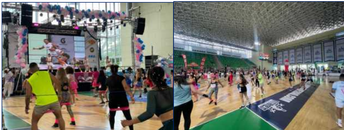
Momentos de XXII Competencia Nacional de Aerobicos realizada en el Estadio Elias Chewing, el pasado 17 de agosto, con el objetivo de integrar a los amantes del fitness y fomentar estilos de vida saludable