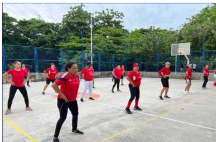
Grupo de mujeres adultas y adultas mayores realizando actividad física