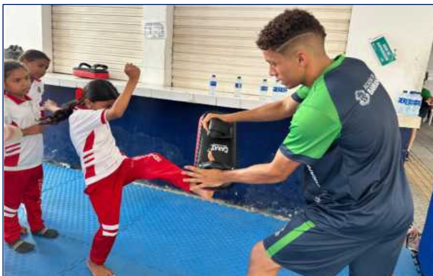
Evento donde las niños, niñas y jóvenes tuvieron la oportunidad de rotar de manera simultánea por las diferentes disciplinas,