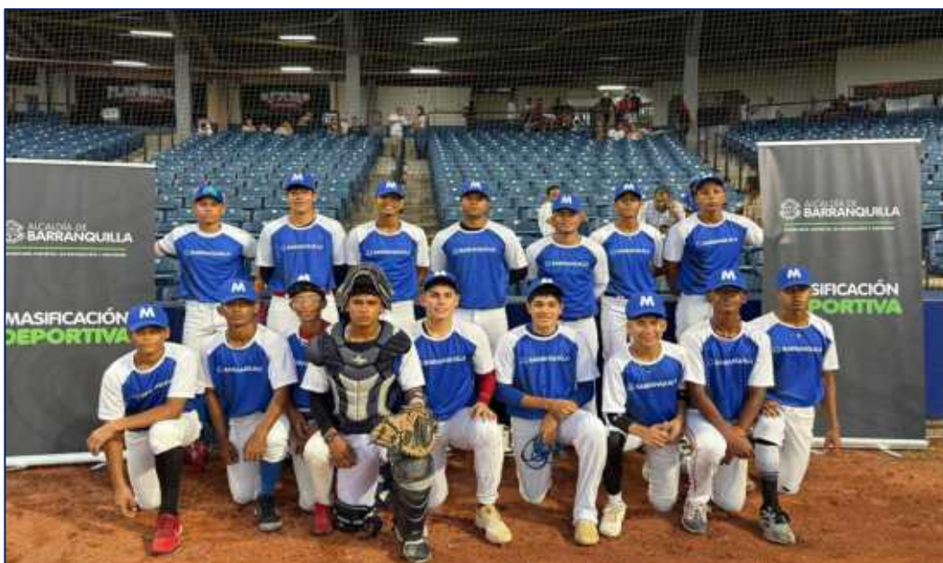
Selección de Beisbol en el estadio Edgar Renteria