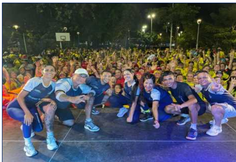
Entrenadores y beneficiarios de la estrategia supersesiones 2.025