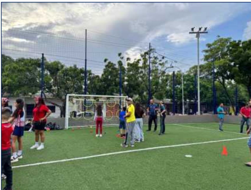
Niños, niñas, jóvenes y adultos disfrutando de las jornadas recreodeportiva adaptada