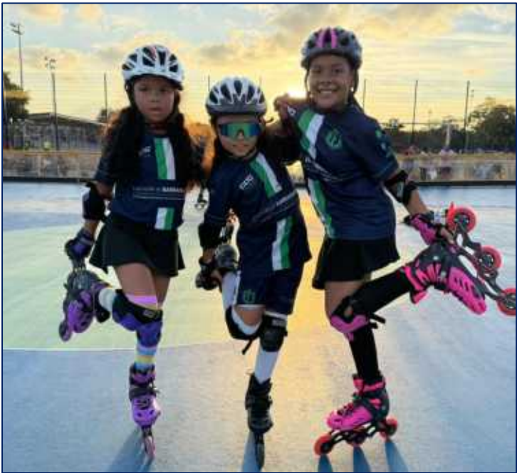
Niñas de la escuela de formación en PATINAJE