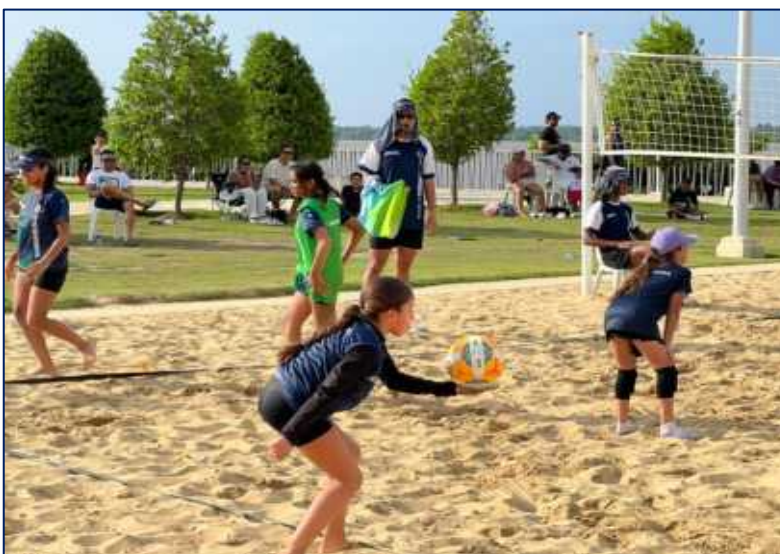
Grupo de niñas recibiendo clases de VOLEYPLAYA en el Gran Malecón