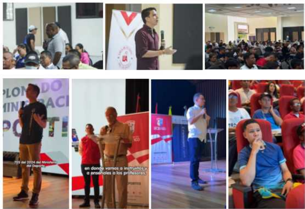
Registros fotográficos de las capacitaciones en el Legislación deportiva realizadas en asociación con Indeportes Atlántico