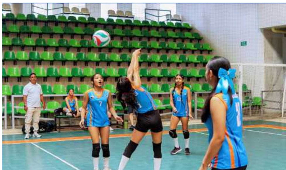
Jóvenes en el torneo interlocalidades de voleibol en el Coliseo Sugar Baby