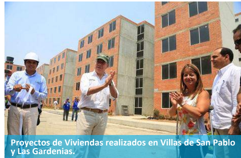
Proyectos de Viviendas realizados en Villas de San Pablo y Las Gardenias.