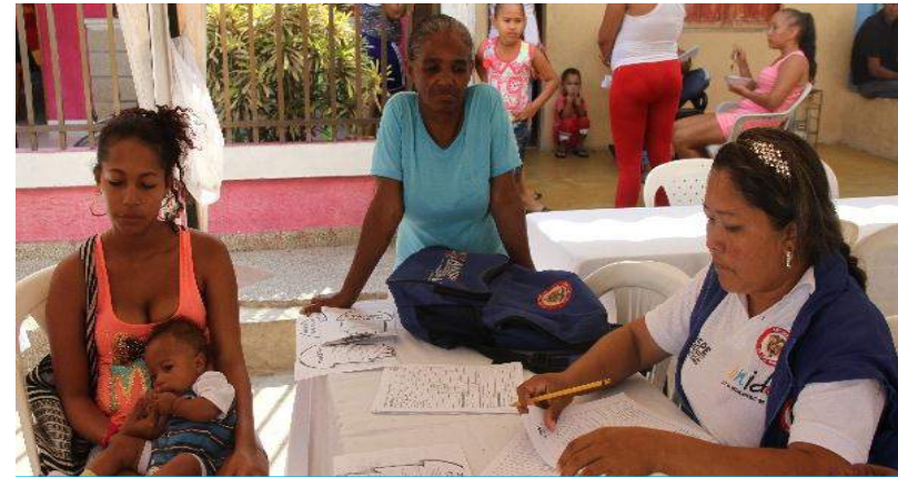
Estrategia ZOLIP en el Barrio Rébolo

El Plan Territorial para la Superación de la Pobreza Extrema – PTSPE, se encuentra en porcentaje de avance del 48% de cumplimiento a solo cuatro meses de haber iniciado la ejecución de la estrategia en el territorio ZOLIP.