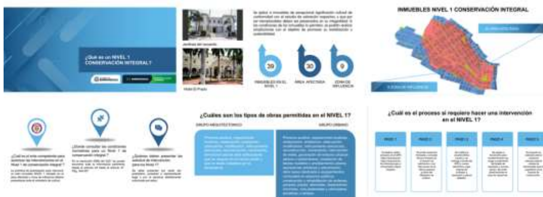
Cartillas didácticas del Plan Especial de Manejo y Protección de los barrios El Prado, Bellavista y una parte de Altos del Prado PEMP (2021), archivo SDCP