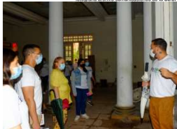
Recorrido Patrimonial Barrio el Prado (2021)