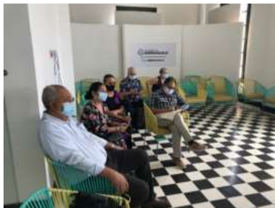
Socialización Plan Especial de Manejo y Protección de los barrios El Prado, Bellavista y una parte de Altos del Prado a los propietarios de inmuebles y representantes de la Corporación zona patrimonial. (2021)