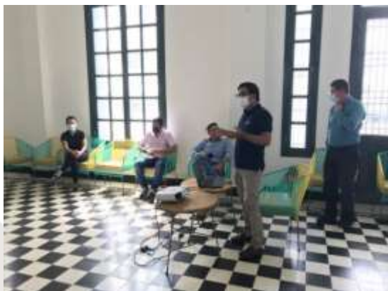
Socialización Plan Especial de Manejo y Protección de los barrios El Prado, Bellavista y una parte de Altos del Prado a los propietarios de inmuebles y representantes de la Corporación zona patrimonial. (2021), fotografía archivo SDCP

Se realizó un segundo encuentro, para la socialización del Plan Especial de Manejo y Protección de los barrios El Prado, Bellavista y una parte de Altos del Prado, a vecinos y habitantes y representantes de la Corporación Zona Patrimonial.