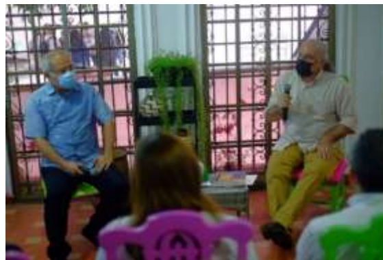
Conversatorio "Obregón, un coloso cosmopolita que decidió ser Barranquillero". (2021), fotografías archivo SDCP.