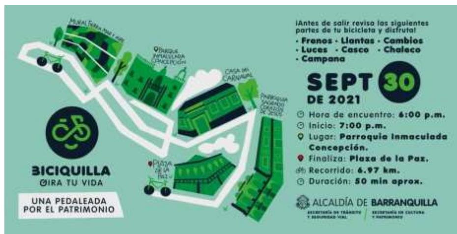
Pieza publicitaria de invitación y recorrido evento Biciquilla “Una pedaleada por el patrimonio”, compartida por redes sociales de la SDCP. (2021)

Durante el trayecto de 6.97 km, los asistentes tuvieron la oportunidad de ver los bienes culturales inmuebles del Plan Especial de Manejo y Protección del sector comprendido por los Barrios Prado, Bellavista y una parte de Altos del Prado de Barranquilla y su zona de influencia, declarado Bien de Interés Cultural del Ámbito Nacional, como son: La Casa del El hotel El Prado, la Parroquia del Sagrado Corazón de Jesús, el mural Tierra Mar y Aire de Alejandro Obregón , generando espacio de interrelación entre la comunidad, el territorio y la memoria, para la generación de identidad.