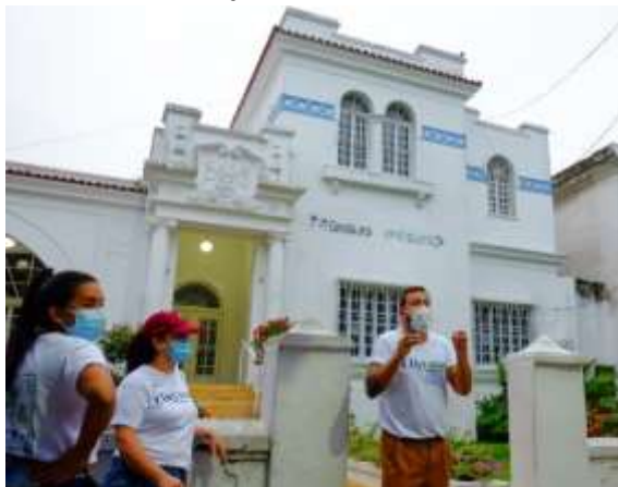
Recorrido Patrimonial Barrio el Prado (2021)