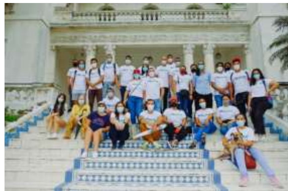
Recorrido Patrimonial Barrio el Prado (2021)