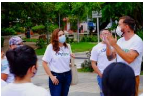
Recorrido Patrimonial Barrio el Prado (2021)

Esta actividad se desarrolla gracias a la vinculación de varias entidades como la secretaria de movilidad, la policía de patrimonio y turismo y organizaciones civiles como CityLover.