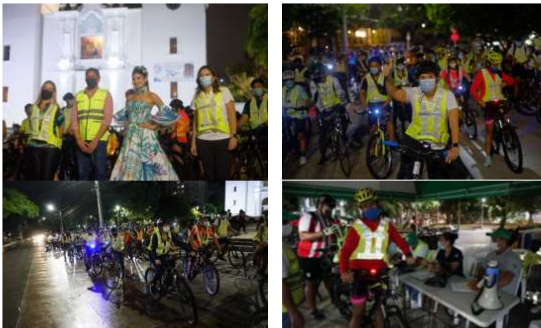
Recorrido sociales de la SDCP del evento Biciquilla “Una pedaleada por el patrimonio” . (2021)