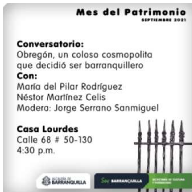
Piezas publicitarias, de invitación, compartida en redes sociales de la SDCP del conversatorio “Obregón, un coloso cosmopolita que decidió ser Barranquillero”. (2021), fotografías archivo SDCP.

Adicionalmente, mediante el acuerdo 02 del 2021, fue una de las 7 obras declaradas como BIC del ámbito Distrital.