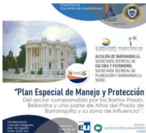
Pieza publicitaria evento "Plan Especial de Manejo y Protección del sector comprendido por los barrios Prado, Bellavista y una parte de Altos del Prado" (2021)

Este evento, simultáneamente, fue transmitido en directo, a través de la Plataforma académica RENATA (Red Académica Nacional Tecnología Avanzada) utilizada en la Universidad del Atlántico.