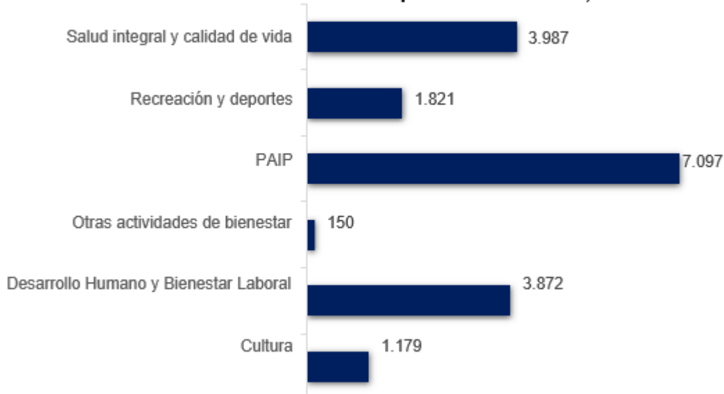
Gráfico 1. Número de atenciones por línea de acción, 2021

La Institución Universitaria ITSA, en 2021, realizó dieciocho mil ciento seis (18.106) atenciones través de sus cinco (5) líneas de atención orientadas al desarrollo integral de estudiantes, con la implementación de actividades recreativas, deportivas, culturales y arte, implementación de actividades de salud integral y calidad de vida y actividades enfocadas al desarrollo humano. Cabe señalar que, con respecto a la vigencia anterior, el total de participaciones en estas actividades se incrementó un 25%. Esta situación es explicada por una parte por el retorno a las actividades presenciales tras las medidas adoptadas por las autoridades nacionales y locales para prevenir y controlar la propagación del Covid-19 y mitigar sus efectos.