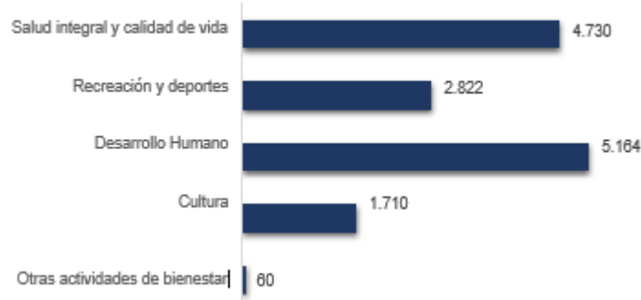
Gráfico 1. Número de atenciones por línea de acción, 2020

prevenir y controlar la propagación del Covid-19 y mitigar sus efectos; a pesar de las estrategias definidas por la Institución para dar continuidad a estas actividades.