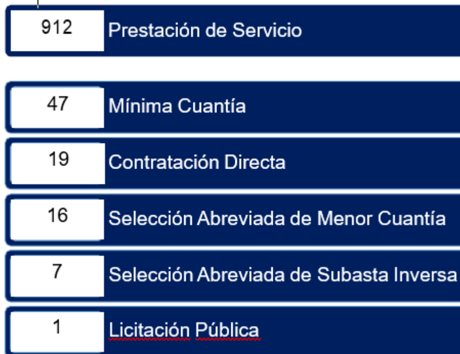
Gráfico 4. Contratos celebrados según el proceso de selección, 2022

En la vigencia 2022, la Institución adjudicó veinticinco mil diecisiete millones seiscientos cuarenta y cuatro mil ochocientos sesenta y uno pesos M/L ($ 25.017.644.861) por medio de la celebración de mil dos (1.002) contratos para la prestación de servicios, adquisición de equipos, dotación de equipos, compra de insumos, adquisición de licenciamientos y pólizas, entre otros. En el siguiente gráfico se presentan las distribuciones de los contratos durante la vigencia según tipo de contratación: