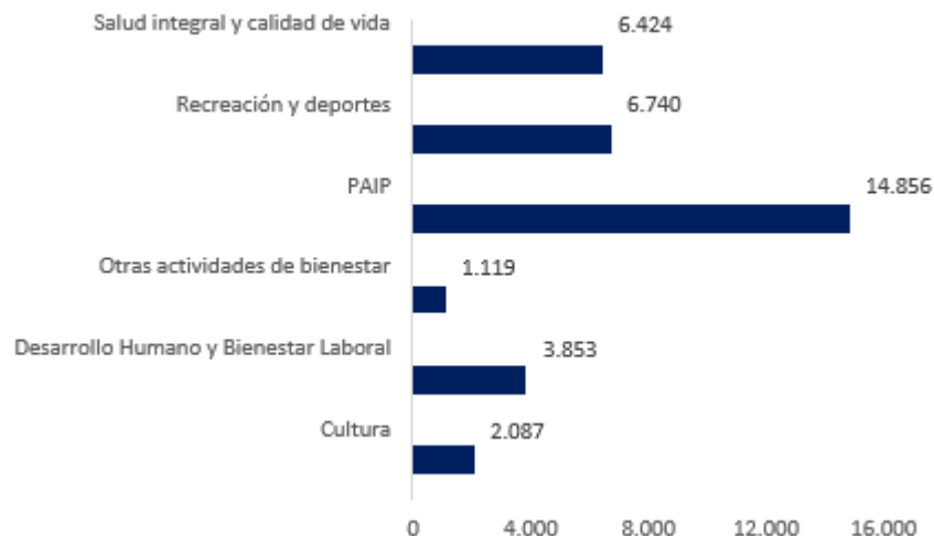
Gráfico 2. Número de atenciones por línea de atención, 2022

La Institución Universitaria de Barranquilla, durante el 2022 realizó treinta y cinco mil setenta y nueve (35.079) atenciones a través de sus líneas de atención orientadas al desarrollo integral de estudiantes, con la implementación de actividades recreativas, deportivas, culturales y arte, implementación de actividades de salud integral y calidad de vida y actividades enfocadas a el desarrollo humano. Con respecto a la vigencia anterior, el total de participaciones en estas actividades aumentó más del doble (166%). En el Gráfico 2, se detalla el número de atenciones por cada una de las líneas definidas por Bienestar Universitario.