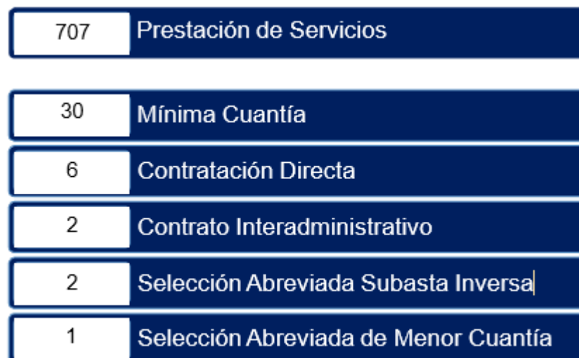
Gráfico 4. Contratos celebrados según el proceso de selección, 2020

En la vigencia 2020, la Institución adjudicó siete mil novecientos setenta y cinco millones cuatrocientos diez mil novecientos setenta y cinco pesos M/L (7.975.410.975) por medio de la celebración de setecientos cuarenta y ocho (748) contratos para la prestación de servicios, adquisición de equipos, dotación de equipos, compra de insumos, adquisición de licenciamientos y pólizas, entre otros. En el siguiente gráfico se presentan las distribuciones de los contratos durante la vigencia según tipo de contratación (Gráfico 4).