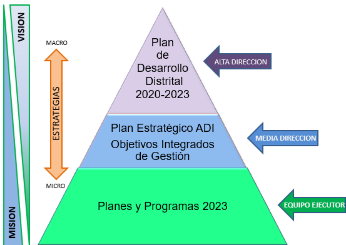
Grafico N° 1 Pirámide estratégica

En el Plan de Desarrollo Distrital “Soy Barranquilla”, 2020-2023, el cual involucra también la iniciativa privada y los esfuerzos coordinados entre sectores y entidades en los ámbitos local, regional y nacional para fortalecer los diferentes aspectos que afectan la competitividad de la ciudad de Barranquilla; desde la perspectiva de ADI , como ente encargado de los aspectos ambientales de los recursos hídricos y los parques públicos de la ciudad de manera que sea delineada una estrategia de desarrollo productivo que considera dos dimensiones complementarias: una vertiente transversal, que actúa sobre las necesidades que son comunes a todas las localidades en un plan de mantenimientos y preservación de arroyos y parques públicos y una estrategia de programas de alto impacto en obras que sean representativas en desarrollo empresarial, innovación y desarrollo tecnológico; ahorro, inversión y financiamiento; capital físico, capital humano; para una mejor ciudad y una mejor calidad de vida de la población.