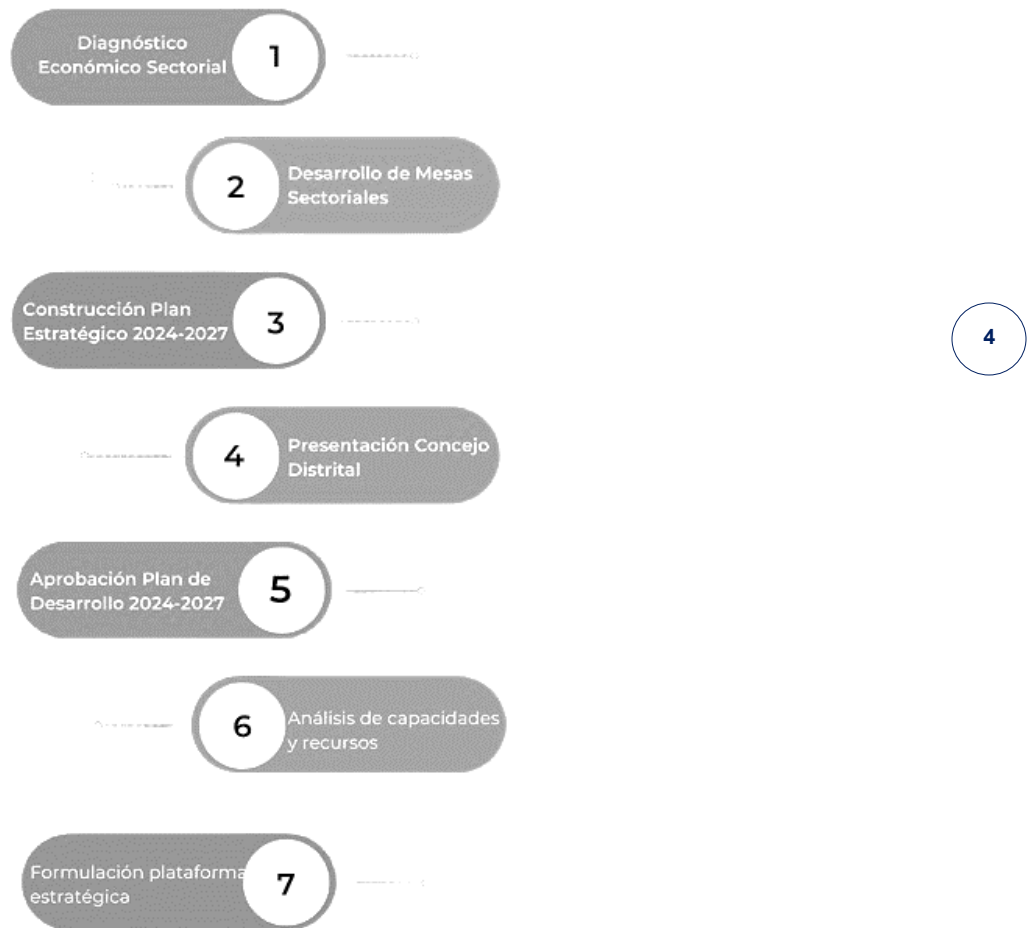
Figura 1. Enfoque metodológico.

La consolidación de la plataforma estratégica de la Secretaría Distrital de Desarrollo Económico ha sido un ejercicio eminentemente participativo, promovido desde la alta dirección de la Secretaria y con el liderazgo de las jefaturas de oficina y sus equipos. Para su desarrollo, fueron planteadas 6 etapas, tal y como se presenta en la siguiente figura: