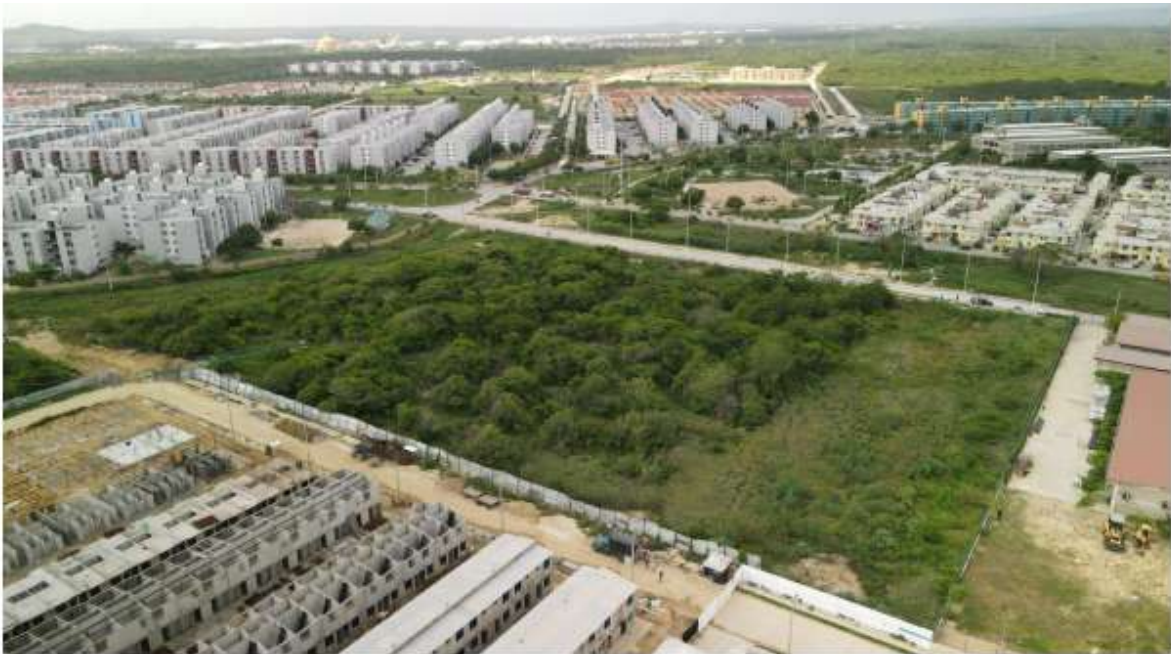
Foto 1 Panorámica Predio – Proyecto Colegio Villas de San Pablo.

Gracias a la ejecución eficiente y con solidez técnica de estas intervenciones administrativas, se logrará transformar la vida de 930 niños que viven en VILLAS DE SAN PABLO II y sus alrededores, actualmente el proyecto cofinanciado por Fundación Pies Descalzos, Findeter, Fundación Mario Santo Domingo, el Distrito de Barranquilla cuenta con licencia de construcción.